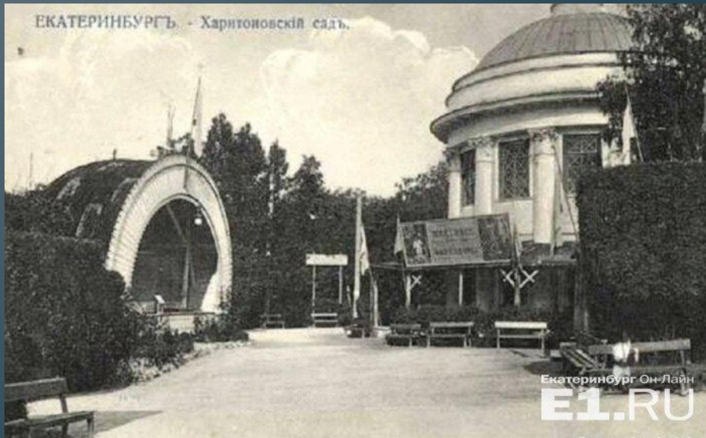
Вторая ротонда и сцена "ракушка"