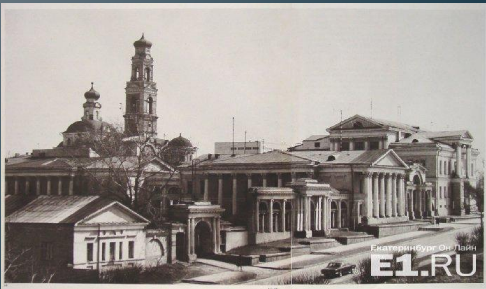
Усадьба Харитонова- Расторгуева