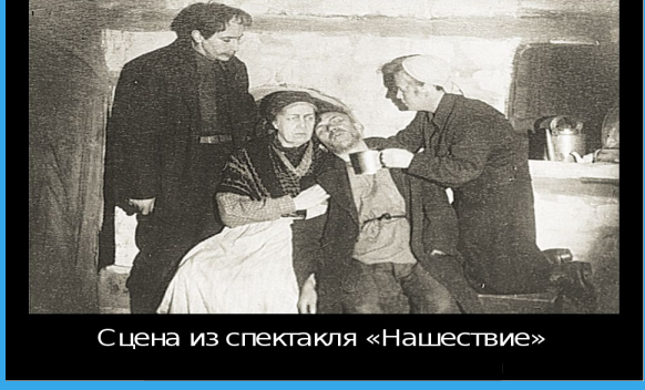
Сцена из спектакля «Нашествие»