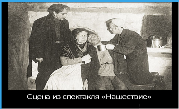
Сцена из спектакля «Нашествие»