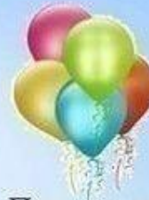
Пять воздушных шаров