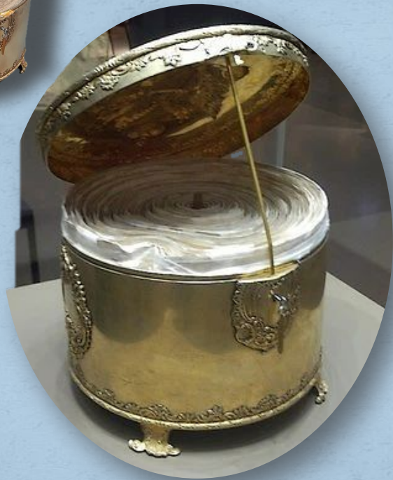
Ковчег со свитком Соборного Уложения