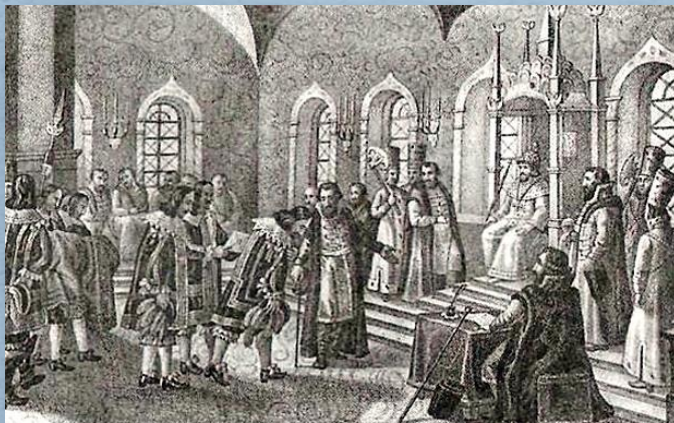
Гравюра «Царь Алексей Михайлович принимает императорского посла барона Мейерберга»