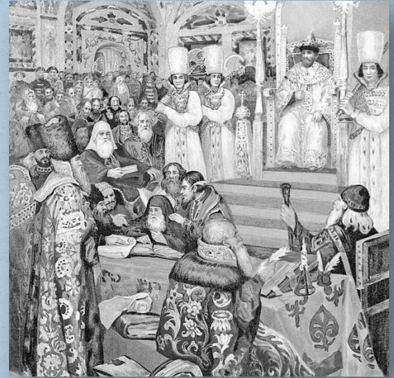
Некрасов Н. Ф. «Составление Соборного Уложения при царе Алексее Михайловиче»