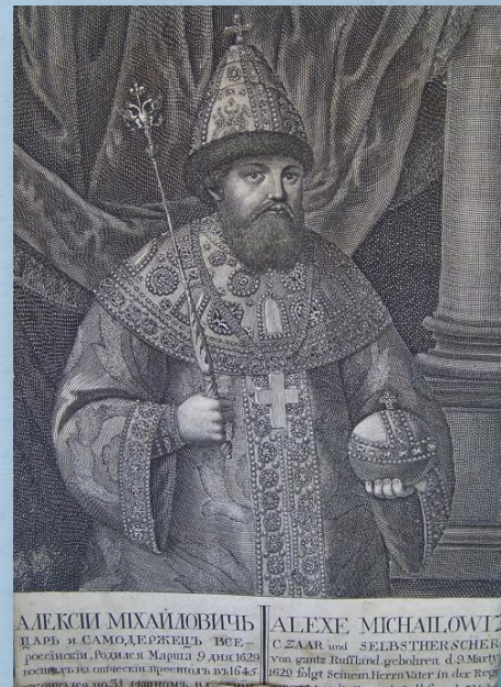
«Царь Алексей Михайлович», гравюра из «Уложения ... Алексея Михайловича ...» СПб, 1737 г.

В работе комиссии принимал участие лично царь Алексей