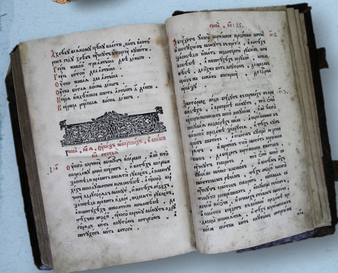
«Уложение царя Алексея Михайловича». 1649 г.