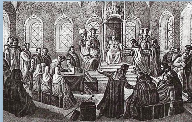
Б. Чориков, гравюра «Царь Алексей Михайлович утверждает Соборное Уложение»