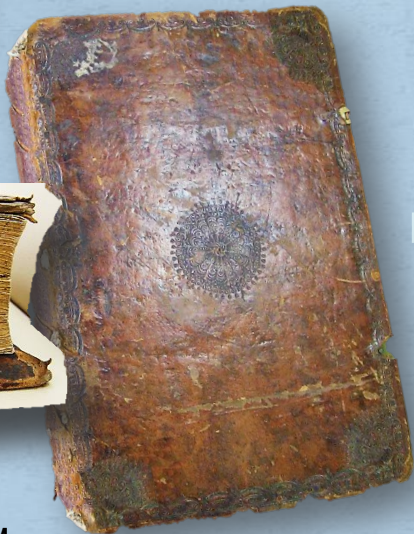
Деревянный переплет книги обтянут кожей и украшен тисненым орнаментом

«Уложение царя Алексея Михайловича» 1649 г.