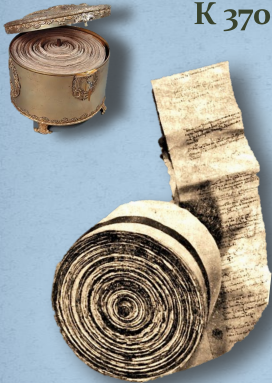
Свиток Соборного Уложения Алексея Михайловича

Документ состоит из 25 глав и 967 статей