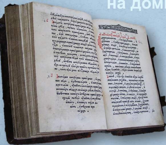
«Уложение царя Алексея Михайловича» 1649 г.