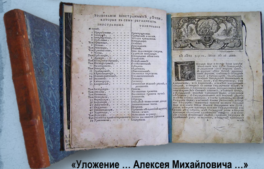
«Уложение ... Алексея Михайловича ...» СПб., 1737 г.