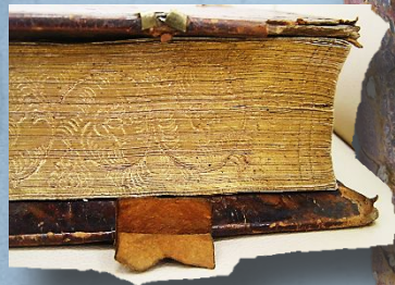
Золотой обрез книги с декоративным тиснением