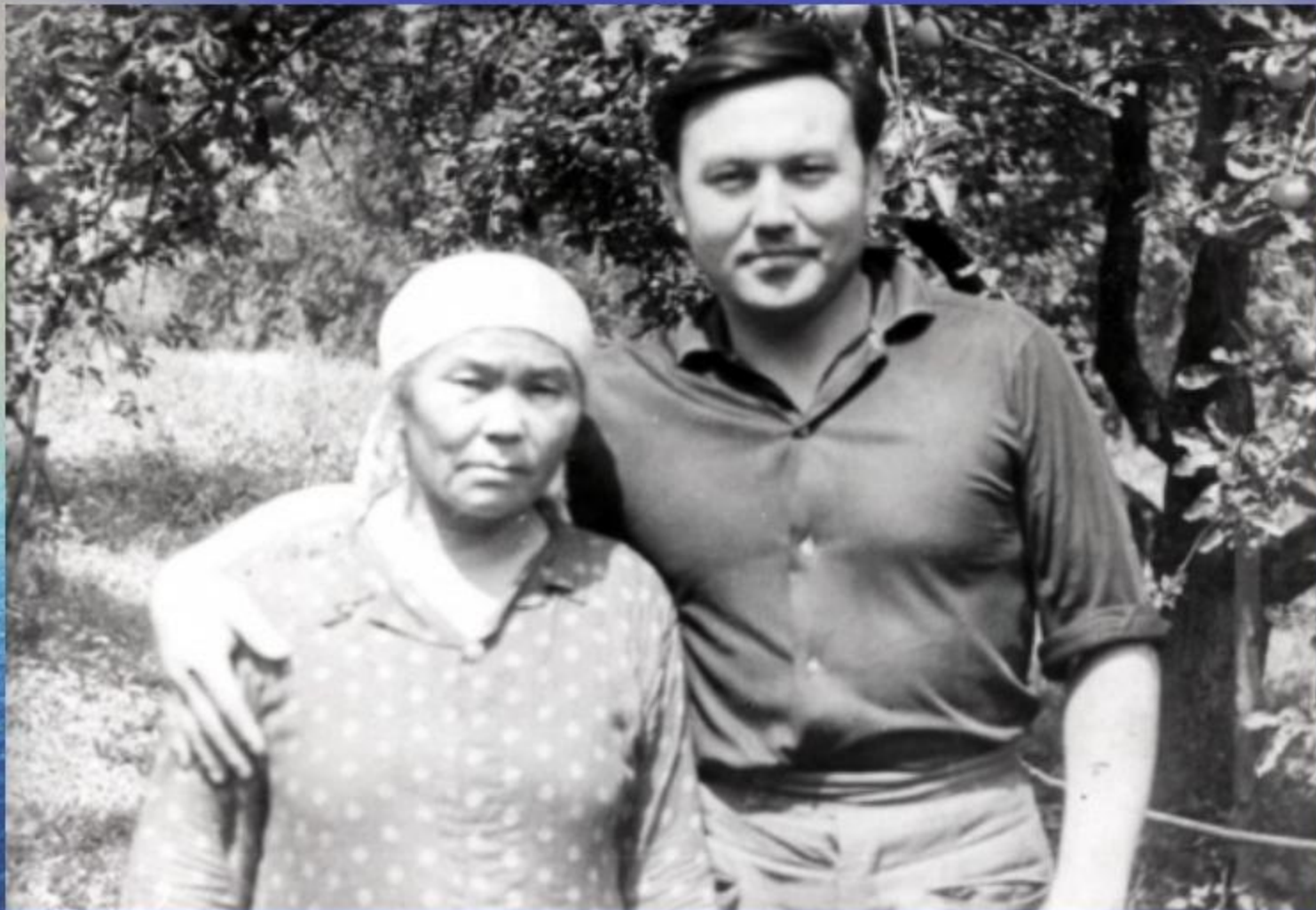
Нұрсұлтан анасы Әлжанмен бірге