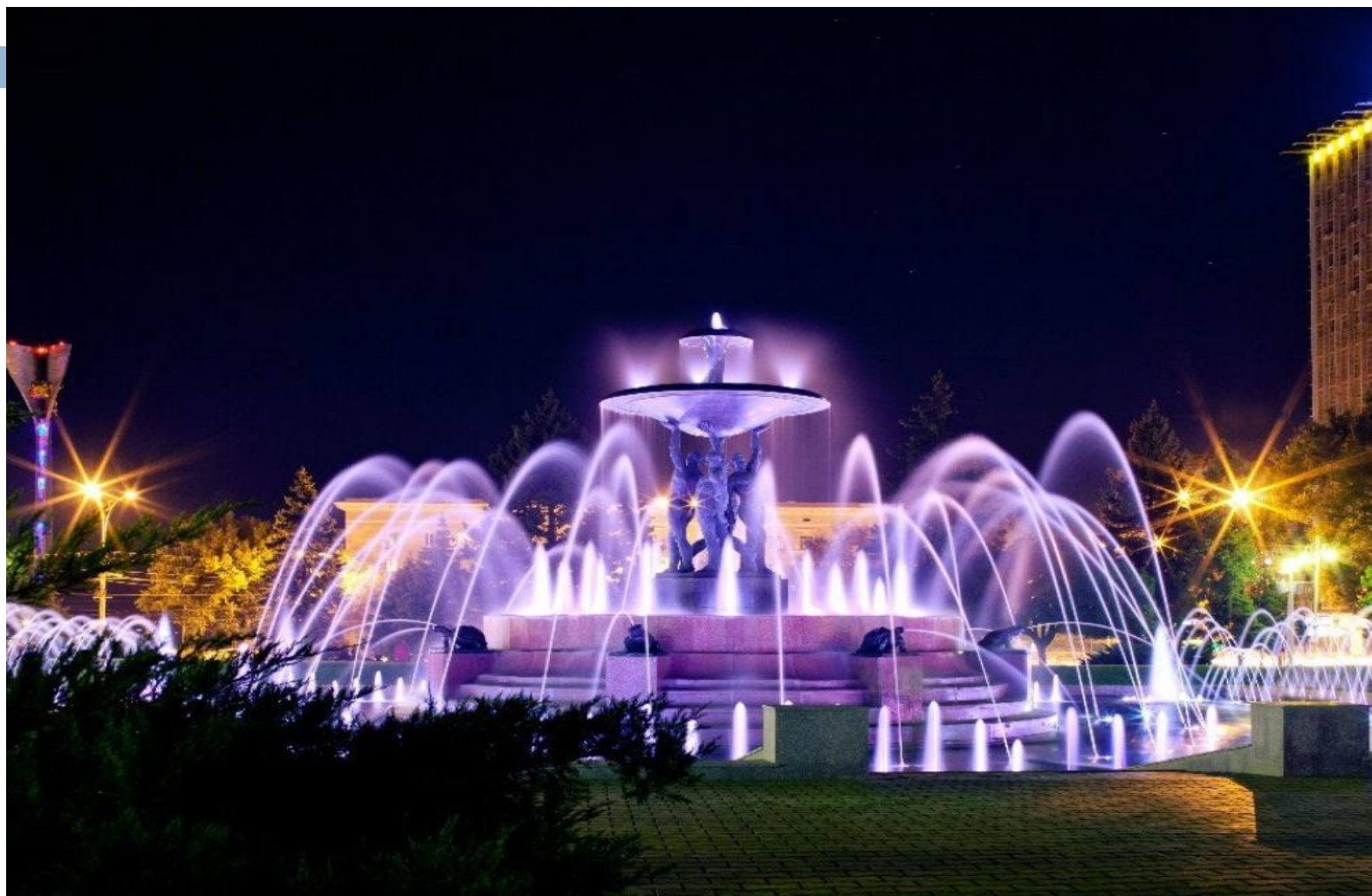
Фонтан на театральной площади