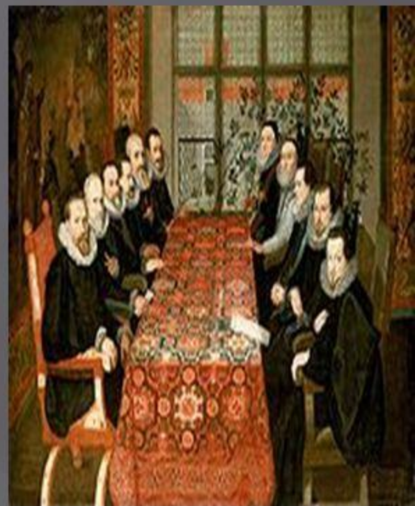
Подписание мира в Сомерсет-хаус, 1604. Справа, второй от окна — Чарлз Ховард