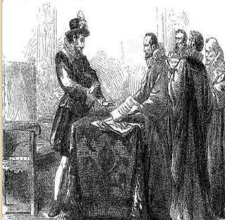
Подписание Нантского эдикта

13 апреля 1598 Генрих IV издал Нантский эдикт, который подвел итог религиозным войнам. «... Мы позволили и позволяем исповедующим ... реформированную религию жить и обитать во всех городах и местах нашего королевства... без преследований, притеснений и принуждений». Из Нантского эдикта