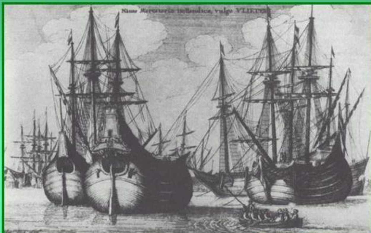
Голландские парусные транспортные суда. Эстамп В.Холлара. 1647 г.

Население Нидерландов занималось сельским хозяйством, мореходством и рыболовством. В стране процветали мануфактуры и торговля, развивалось капиталистическое предпринимательство. Нидерландские корабли были лучшими в мире.