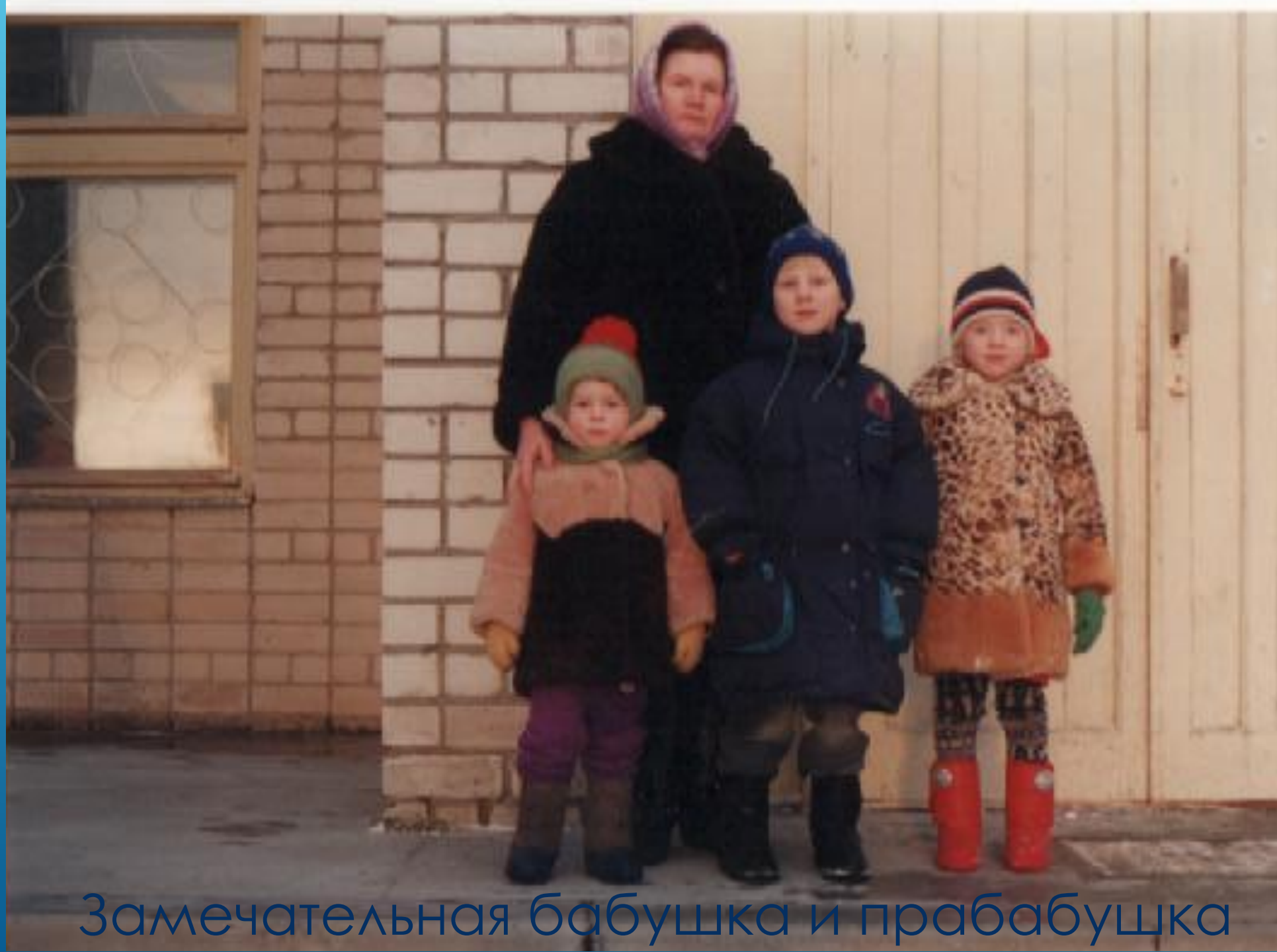
Замечательная бабушка и прабабушка