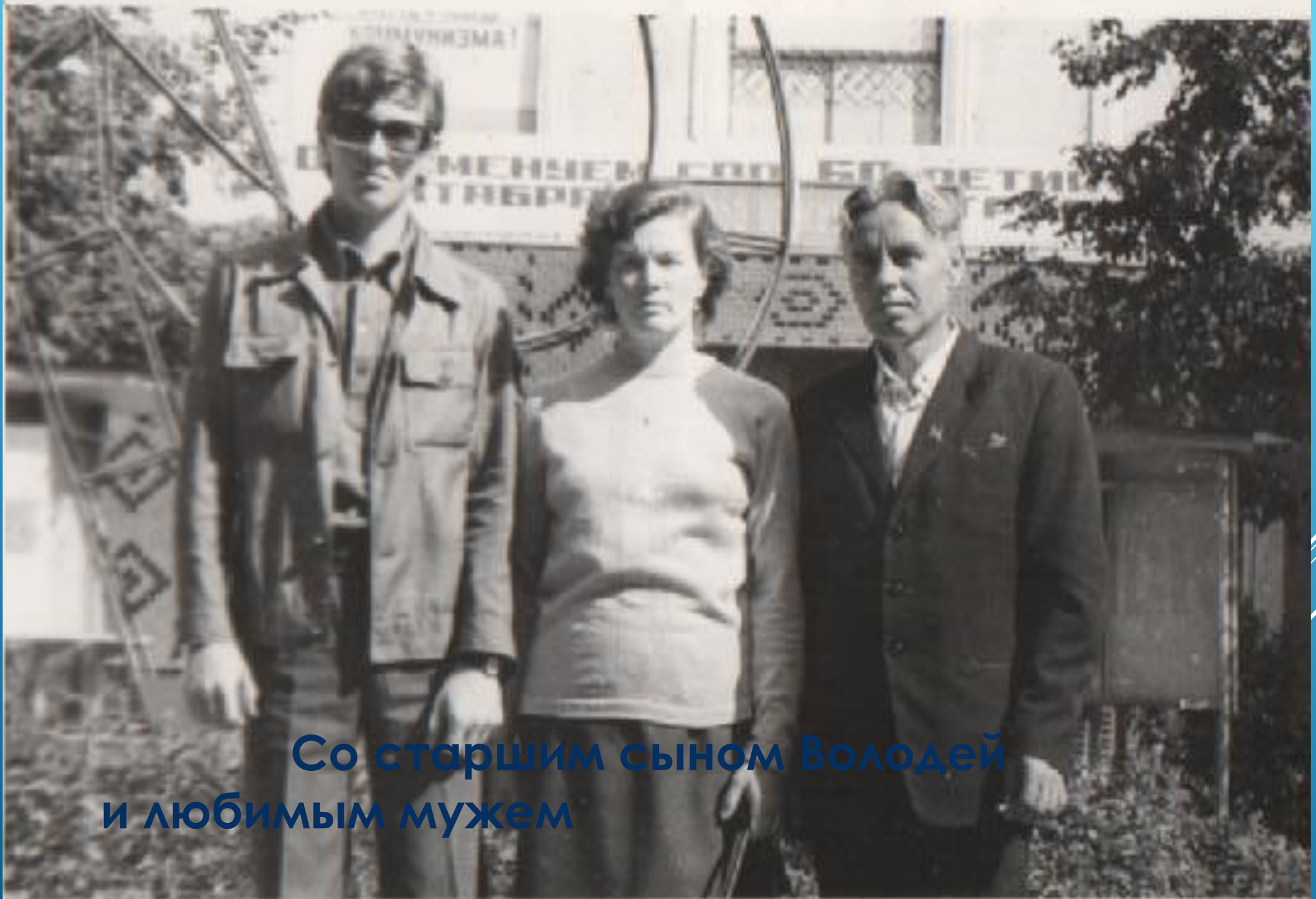
Со старшим сыном Володей и любимым мужем