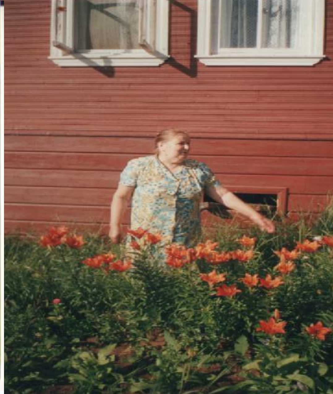
На все руки мастерица