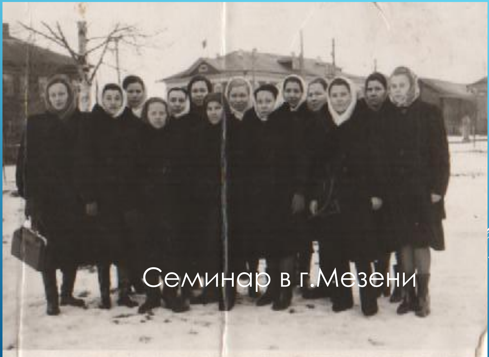
Семинар в г.Мезени