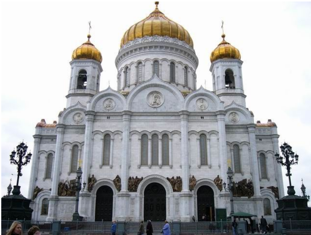
Константин Андреевич Тон. Храм Христа Спасителя. Русско-византийский стиль