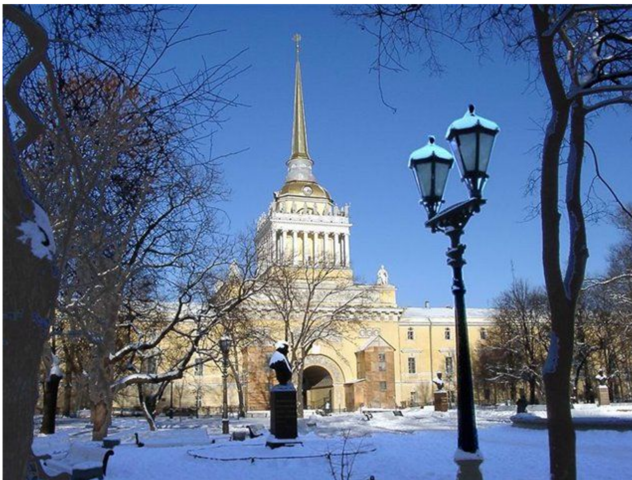
«Адмиралтейство». Андрей Дмитриевич Захаров