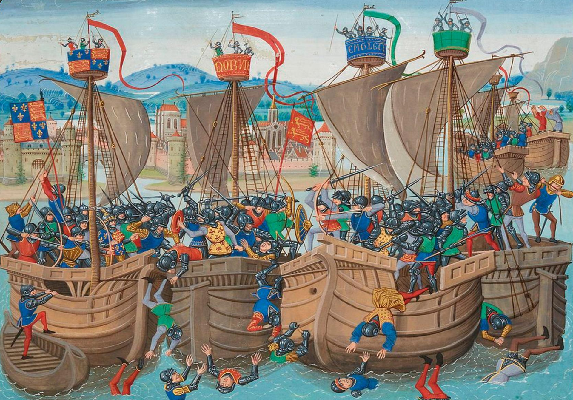
Битва при Слейсе. Средневековая миниатюра