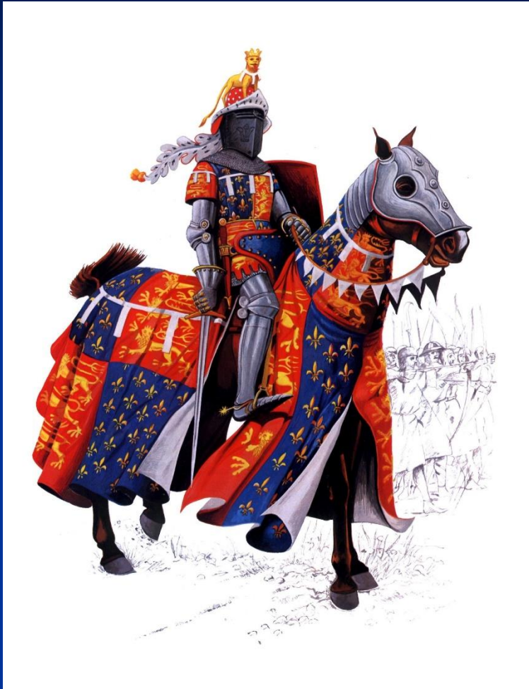
Эдуард Черный Принц. Рисунок

1346 – 1351 – эпидемия чумы в Европе (« Черная смерть »)