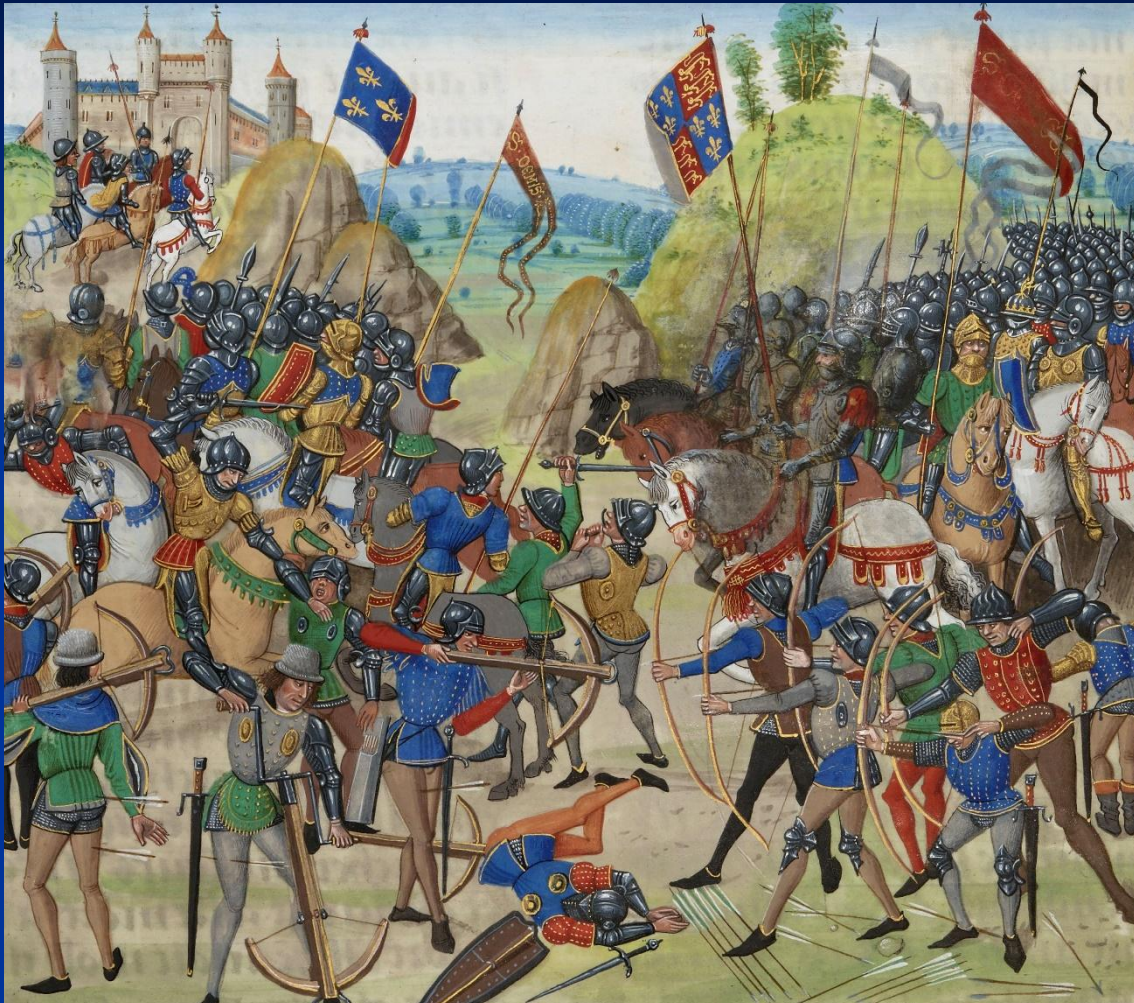
Битва при Креси. Средневековая миниатюра