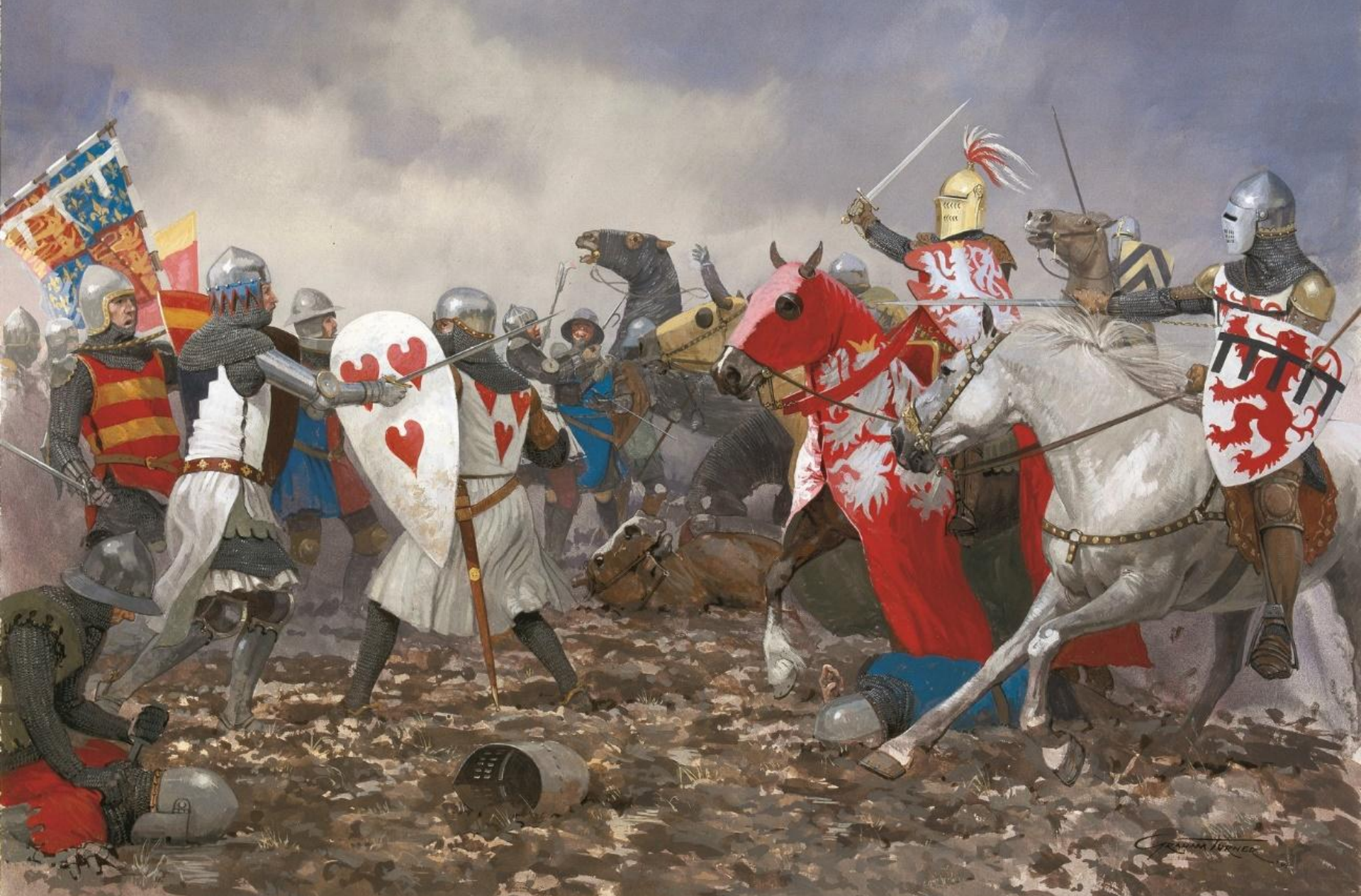
Король Богемии Иоанн Люксембургский в битве при Креси. Рисунок