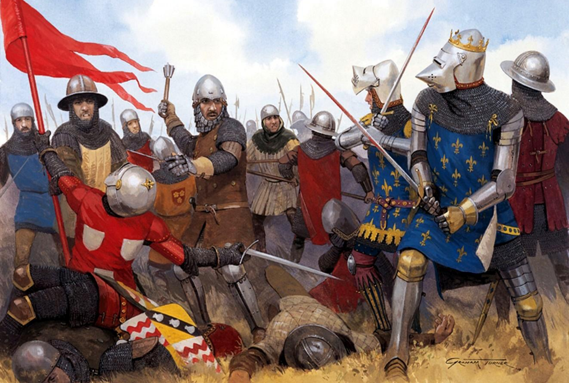
Битва при Пуатье. Рисунок