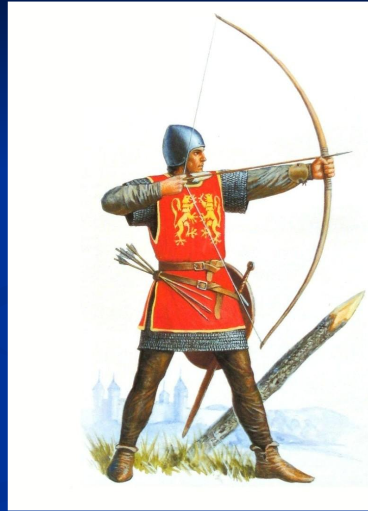
Английский лучник. Рисунок