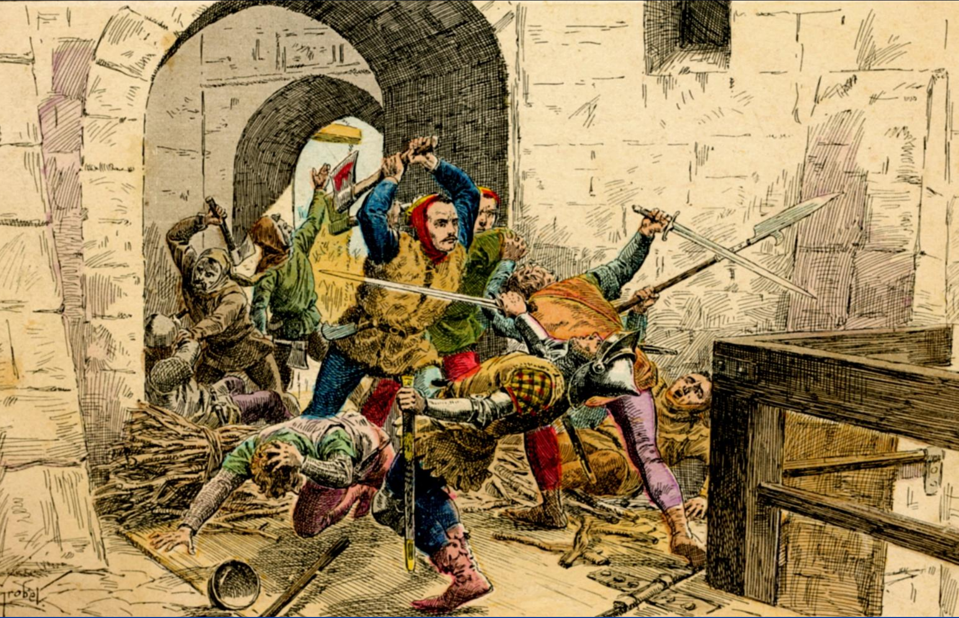
Восставшие крестьяне берут штурмом рыцарский замок. Рисунок