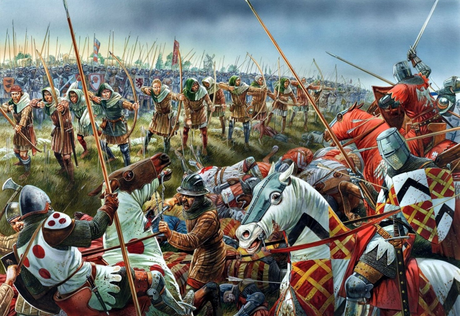
Английские лучники при Креси. Рисунок