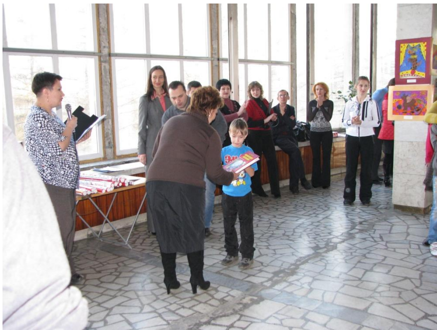
Открытие первой выставки в Цирке 2010 год