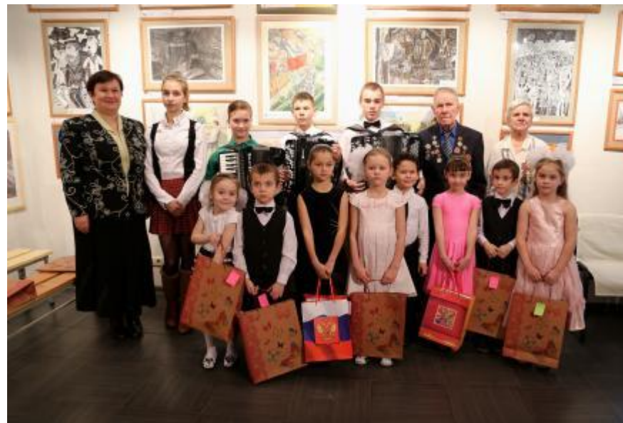
Открытие выставки в Арт-галерее Романовых