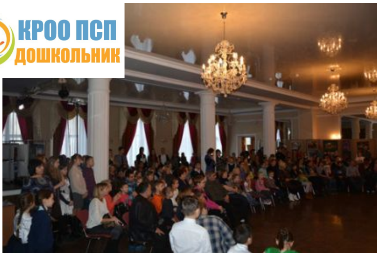
Открытие выставки в Доме Офицеров