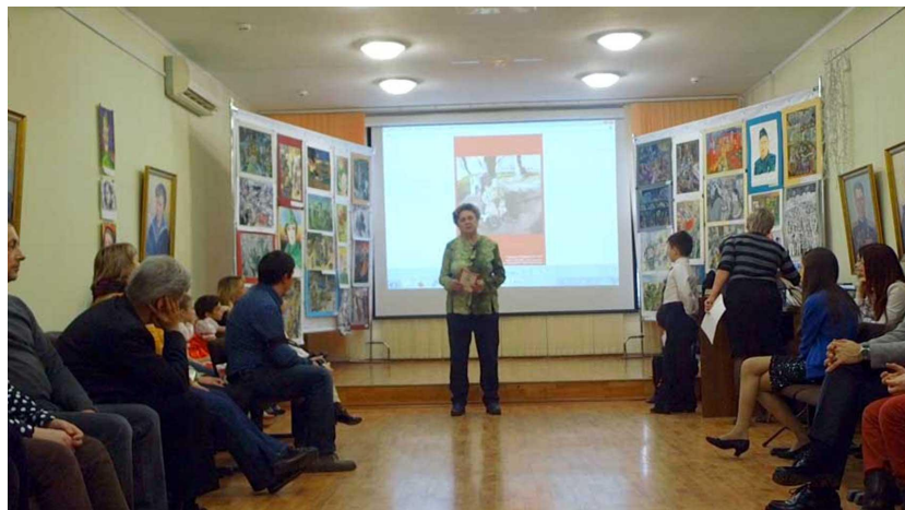
Выставка и встреча с ветеранами в Краеведческом музее