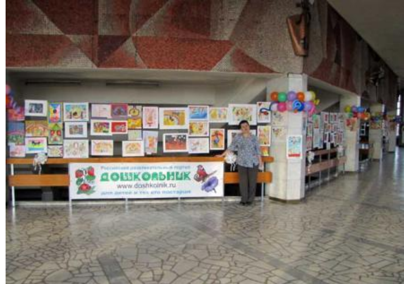
Выставка «Снегири» в Цирке

Цель: ВОСПИТАНИЕ ПАТРИОТИЧЕСКИХ ЧУВСТВ И ЛЮБВИ К РОДИНЕ СРЕДСТВАМИ ИЗОБРАЗИТЕЛЬНОГО И ЛИТЕРАТУРНОГО ИСКУССТВА;