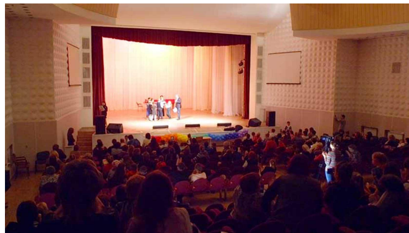
Открытие выставки во Дворце Пионеров