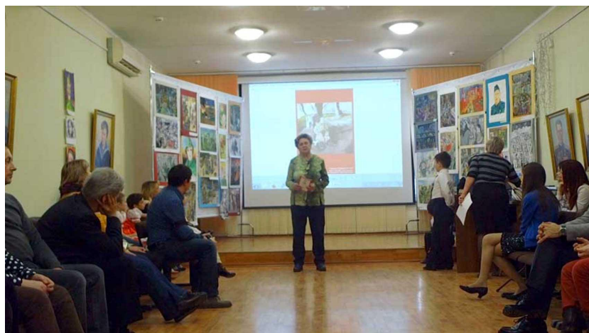
Выставка и встреча с ветеранами в Краеведческом музее