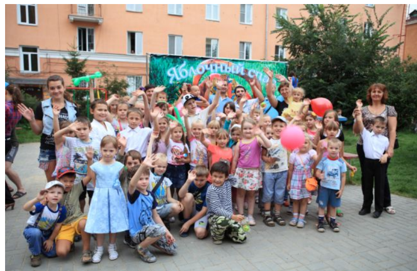
Концерт и угощения для детей Донбаса