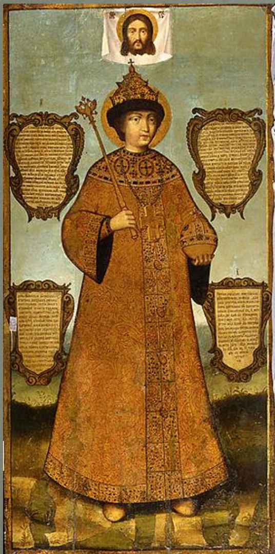
Федор Алексеевич (1676-1682)