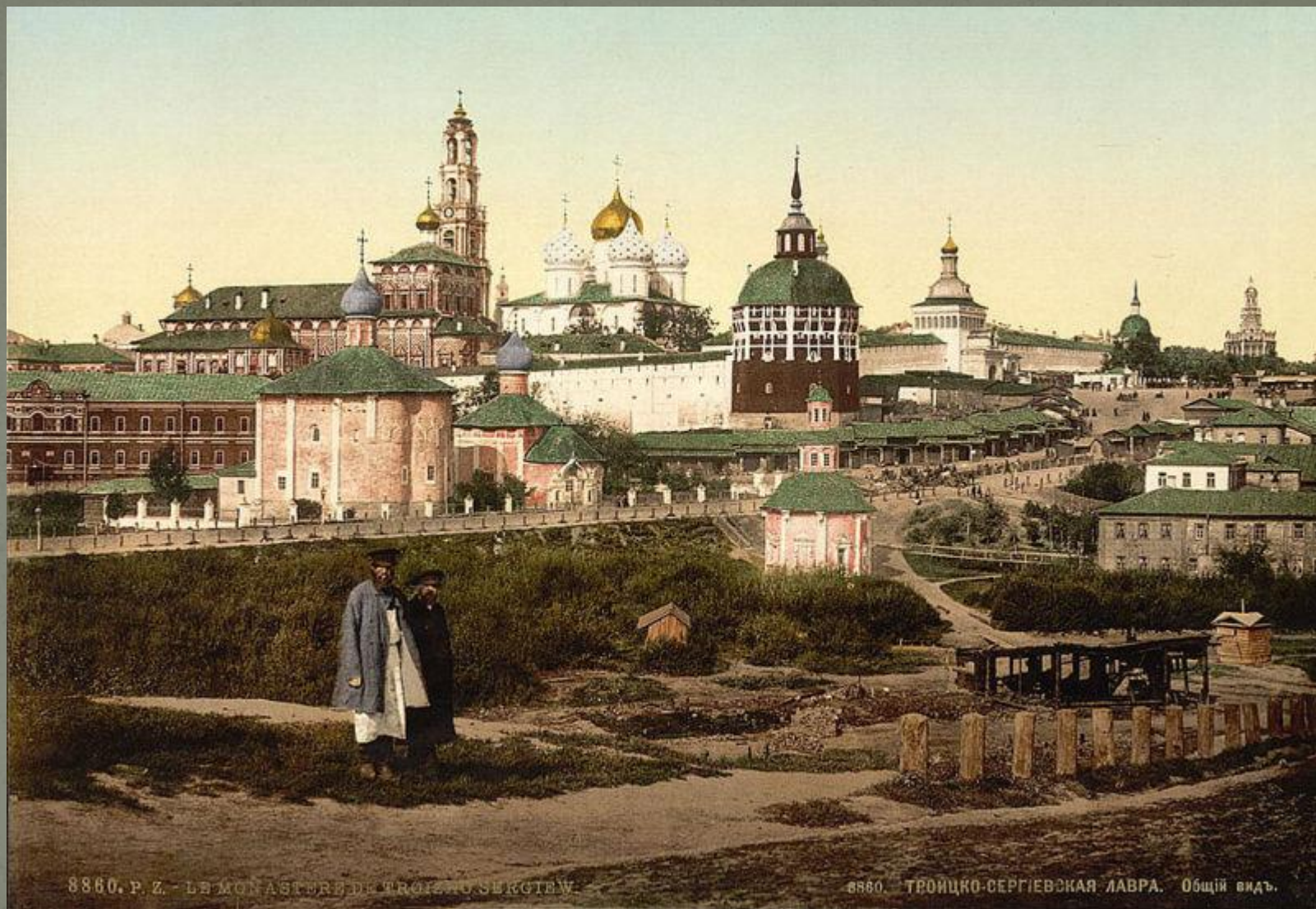
Вид на Троице-Сергиеву лавру. Картина работы Б. М. Кустодиева 1890-е годы