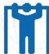
Зарядка с чемпионом