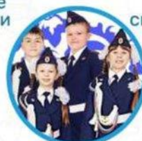
Юные инспектора дорожного движения