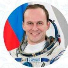
Председатель РЯЗАНСКИЙ Сергей Николаевич Герой Российской Федерации, лётчик-космонавт