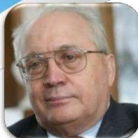
Садовничий Виктор Антонович Президент Российского Союза ректоров, ректор МГУ им. Ломоносова