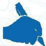
Автограф и фотосессии