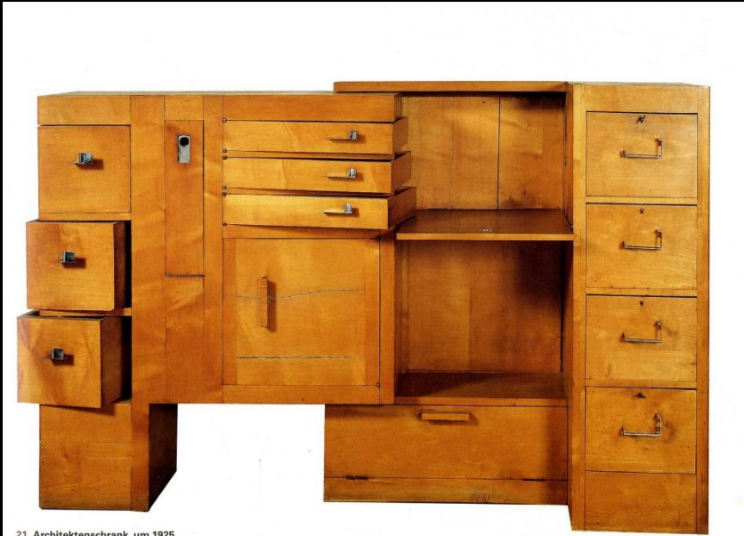
21 Architektenschrank, um 1925 21 Architect's cabinet, circa 1925 21 Cabinet d'architecte, vers 1925