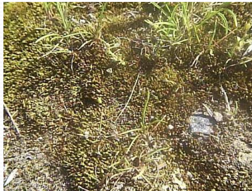
Лакмус (добывают из лишайников)