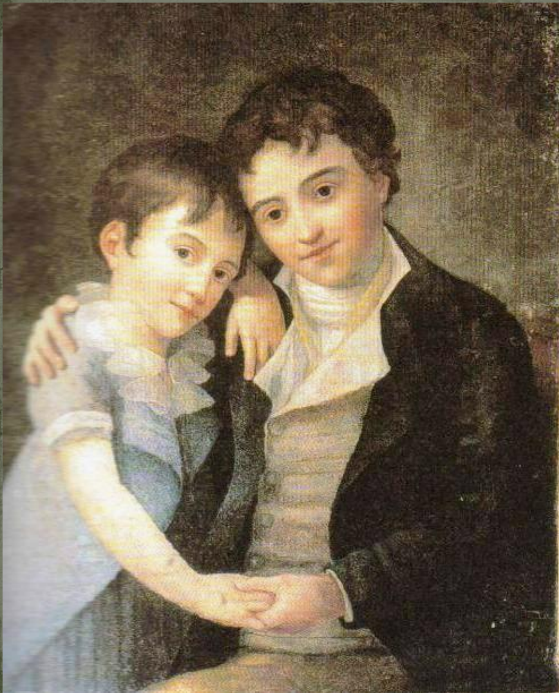
Дети А.В. Моцарта Франц Ксавер Вольфганг и Карл Томас.