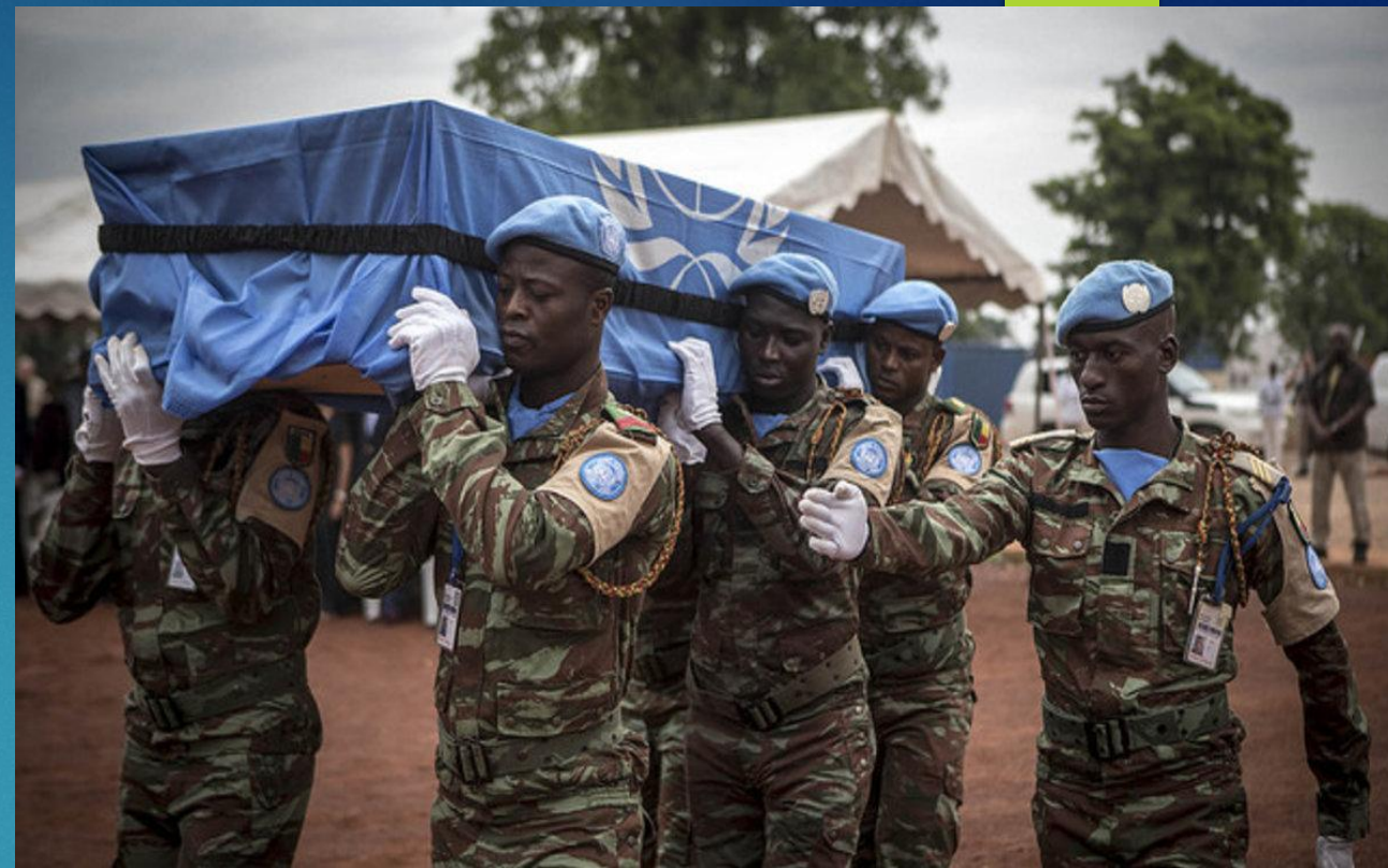
Top ten troop contributors (as of October 2017)