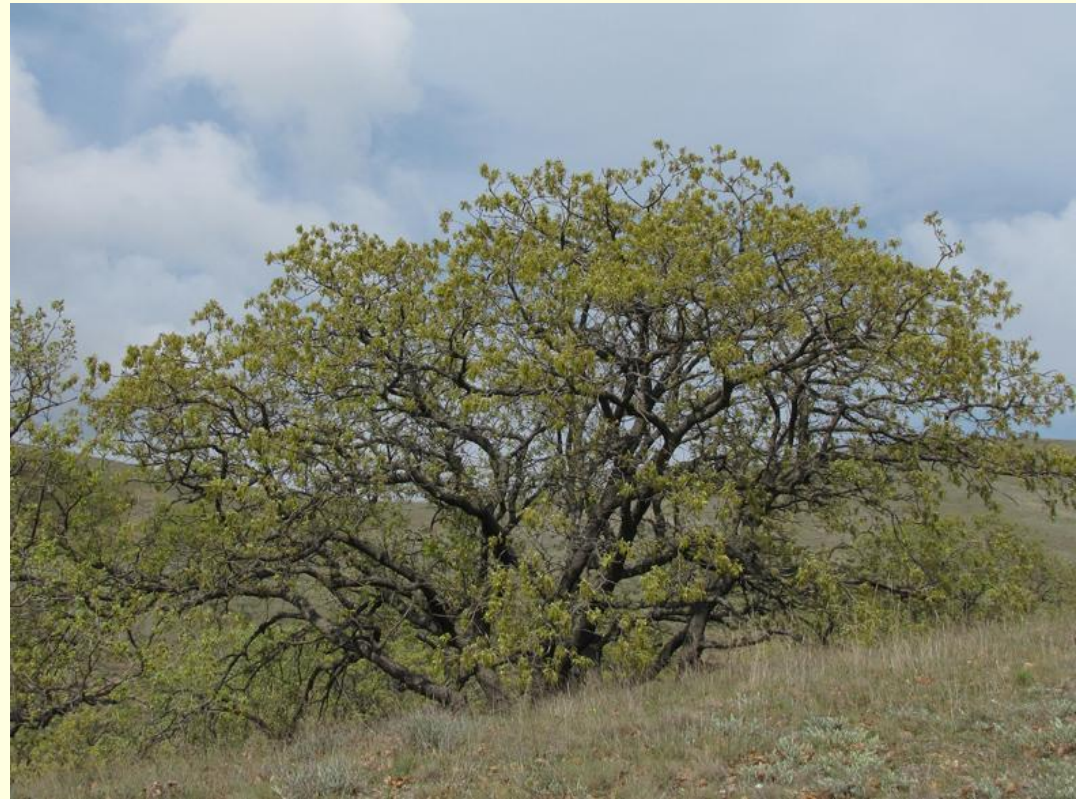
Дуб пушистый. Взрослое растение

заросли низкорослых колючих ксерофитных кустарников и невысоких деревьев