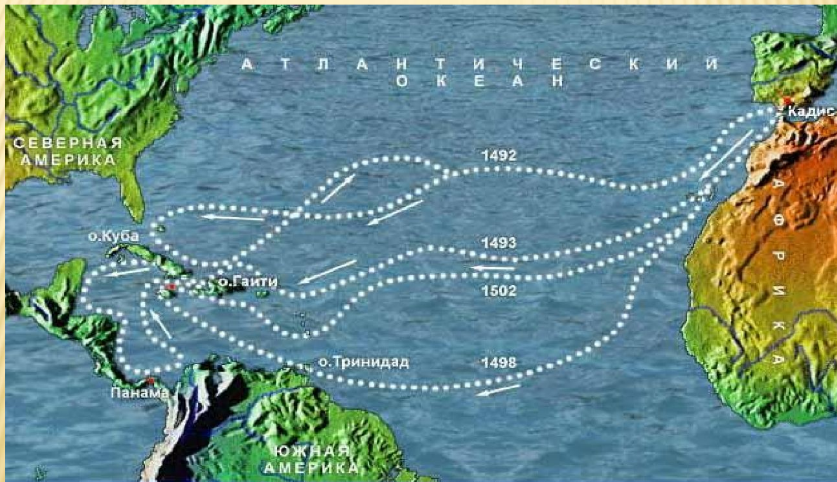
Маршруты плаваний Христофора Колумба.