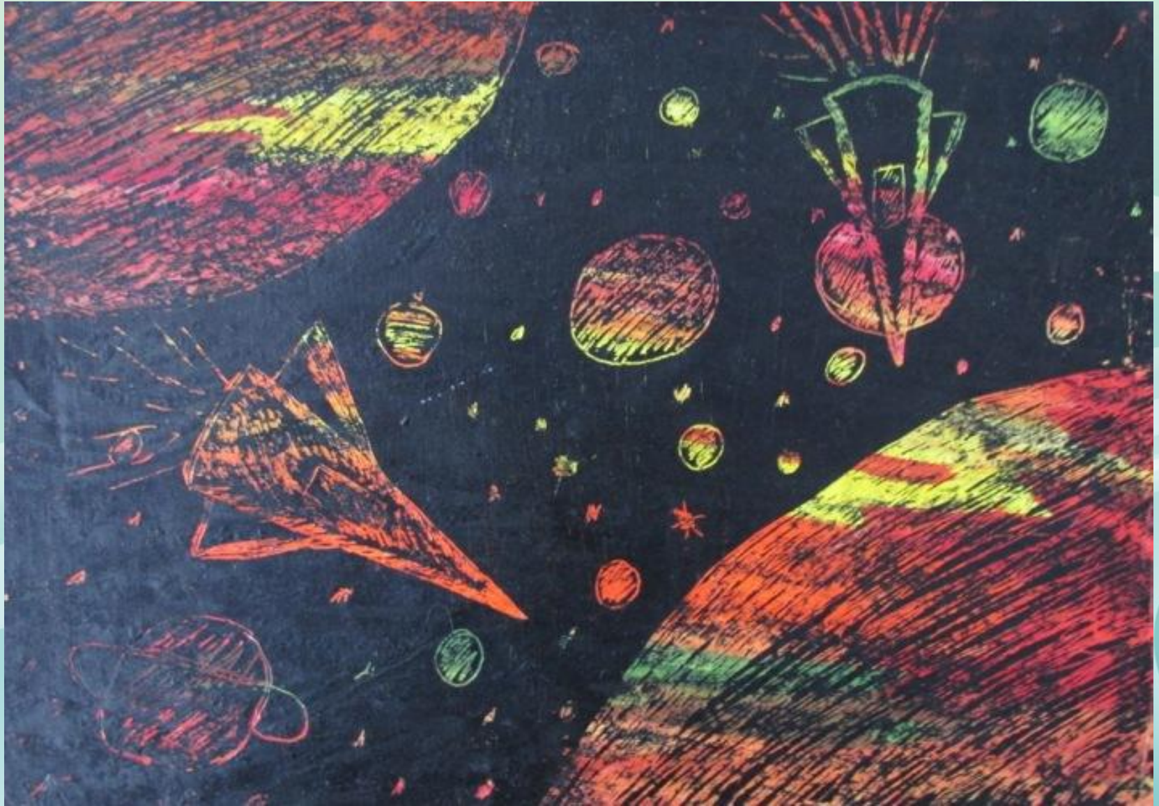
Космос. Заяц А. 5-А кл.