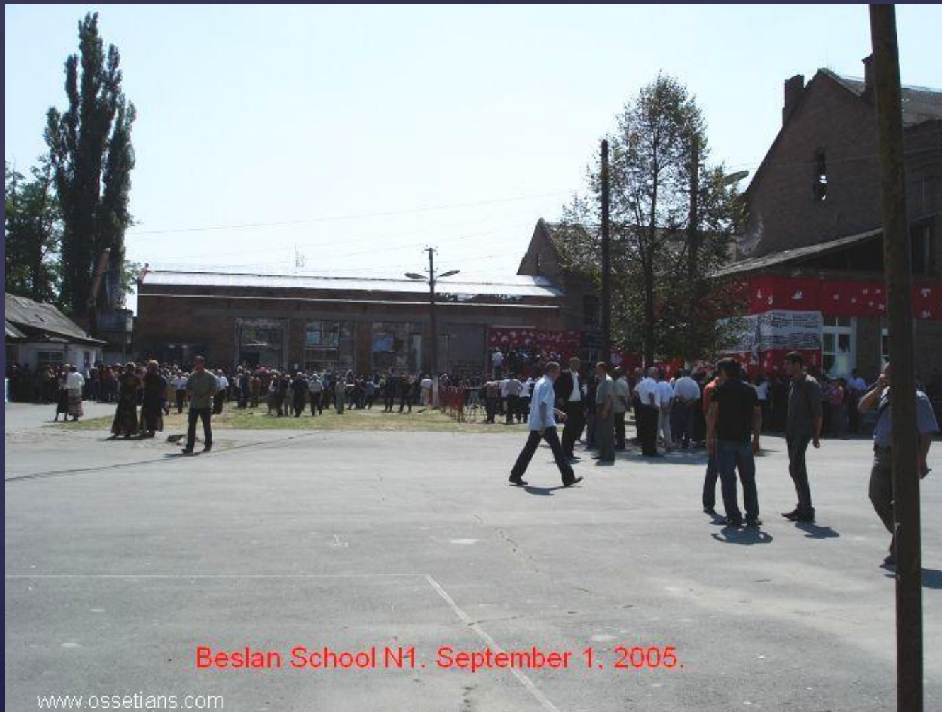
Beslan School N1. September 1, 2005.

Теракт в Беслане был спланирован тщательнейшим образом. Целью террористов был вывод российских войск из Чеченской республики и признание Чечни независимым государством и выпустить боевиков, арестованных за нападение на Ингушетию.