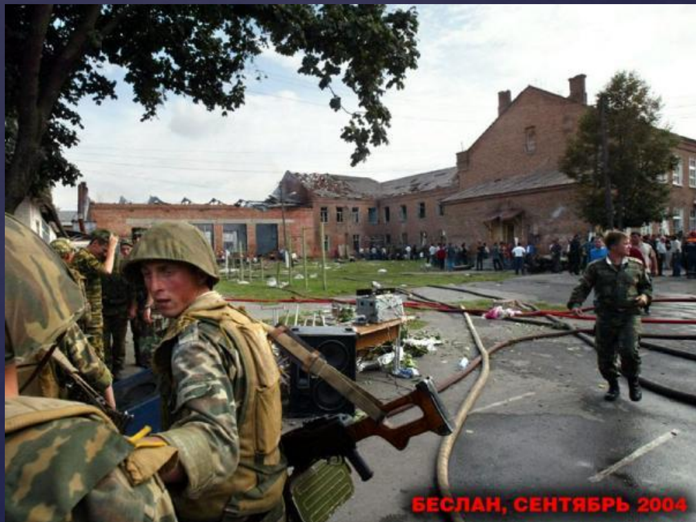
БЕСЛАН, СЕНТЯБРЬ 2004