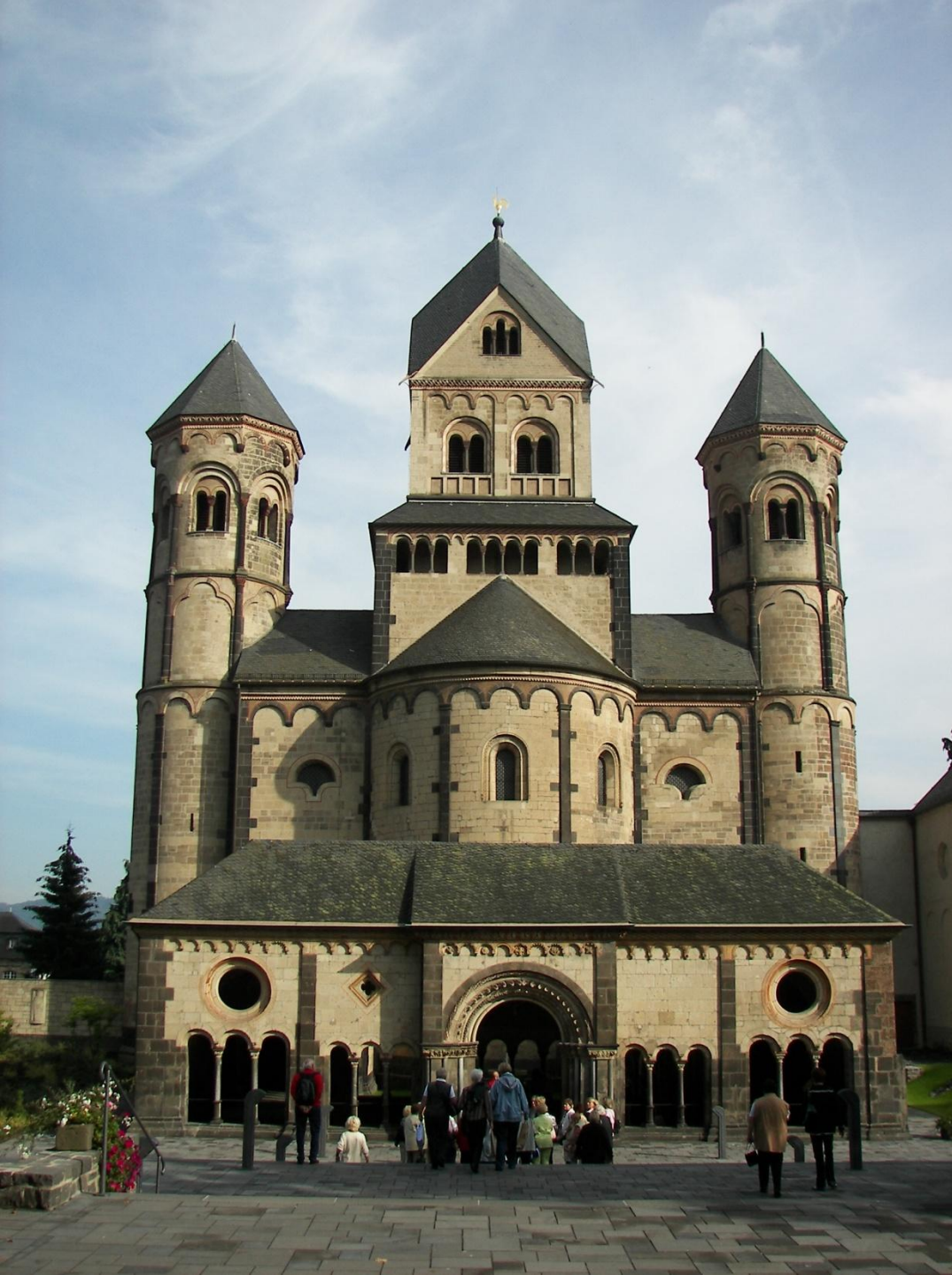
Аббатство Мария Лаах, Германия