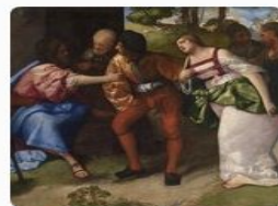
Блудница перед Христом