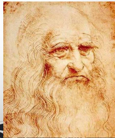
Леонардо да Винчи