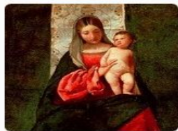
Мадонна со святыми