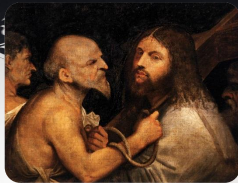
«Христос, несущий крест»

Первой картиной, выполненной художником полностью самостоятельно, стало полотно «Христос, несущий крест» , созданное в 1497 году. Через три года ему довелось повстречаться с великим Леонардо да Винчи (по сохранившимся записям Вазари). Еще через 4 года он написал «Мадонну Кастельфранко» - алтарный образ в часовне Св. Георгия в городском соборе.