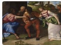
Блудница перед Христом