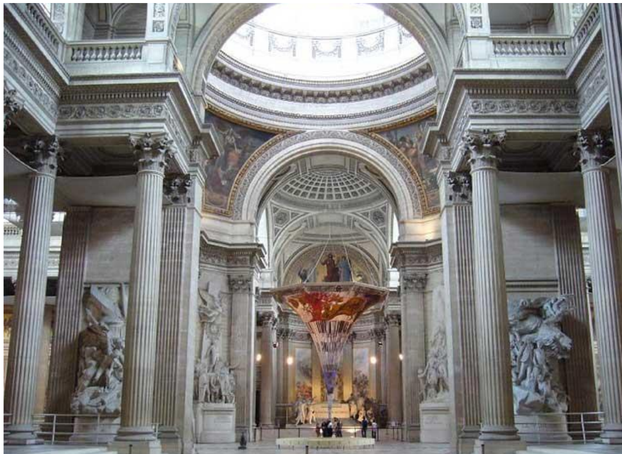
Пантеон - вид внутри