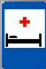
"Пункт первой медицинской помощи"