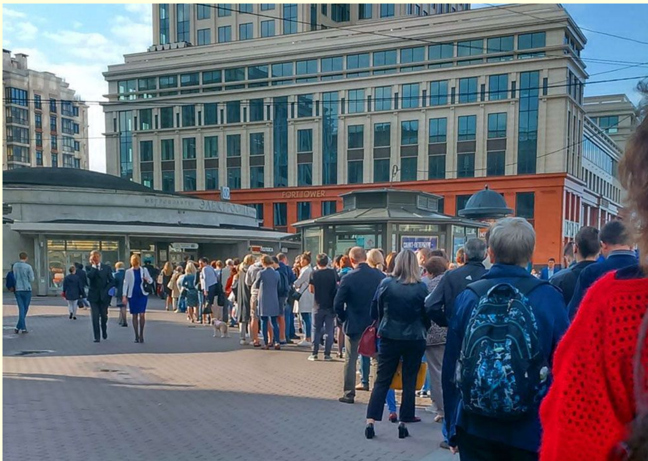
Очередь в метро "Электросила" на досмотр в дни действия "эксперимента на кошках" 30.07.2017

"Как показала неделя, весь город видел, насколько не продумана в настоящий момент нормативная база. Поэтому начальник метрополитена написал официальные письма в адрес министра транспорта РФ Максима Соколова и губернатора Георгия Полтавченко с предложением пересмотреть нормативную базу и внести в нее изменения. В письме приводятся примеры и конкретная статистика проверенных на станциях людей. Также указано количество случаев, когда приходилось в течение недели прерывать работу вестибюлей, ограничивать вход на станции или вообще их закрывать"