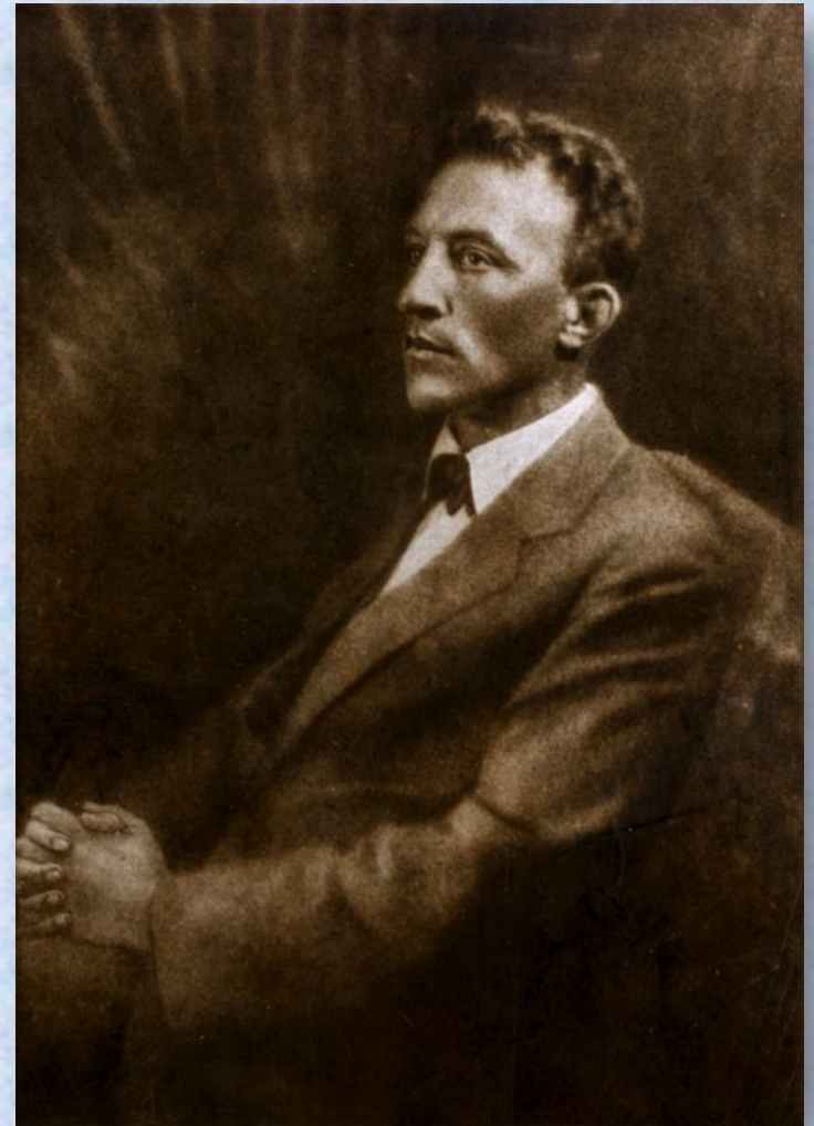
Александр Блок Усталость

И есть ланит живая алость, Печаль свиданий и разлук... Но есть паденье, и усталость, И торжество предсмертных МУК.