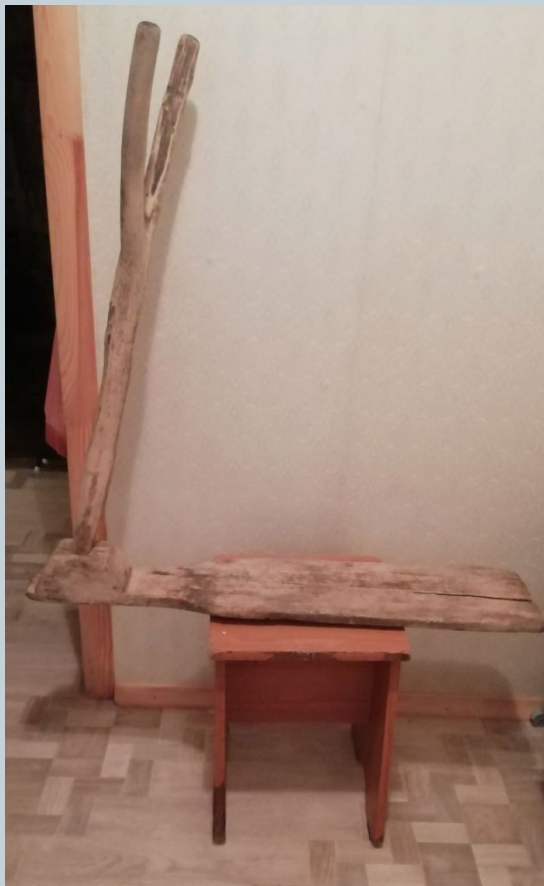
самопрялка или ручное веретено