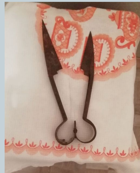
НОЖНИЦЫ ДЛЯ СТРИЖКИ ОВЕЦ