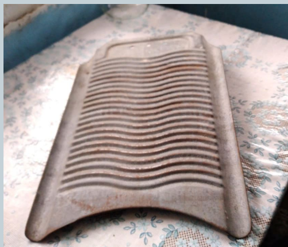
доска для стирки