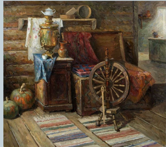
Калинин Михаил. Натюрморт с сундуком