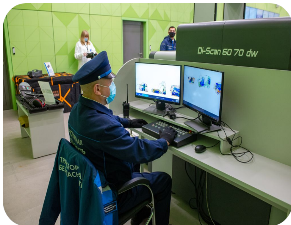
Численный состав подразделения транспортной безопасности ГУП «Мосгортранс»

I МАВ «Северные ворота» с 01.02.2021 под защитой подразделения транспортной безопасности ГУП «Московский метрополитен»