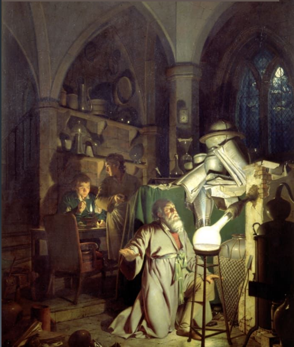
Алхимик в поисках философского камня (Джозеф Райт, 1771 год)