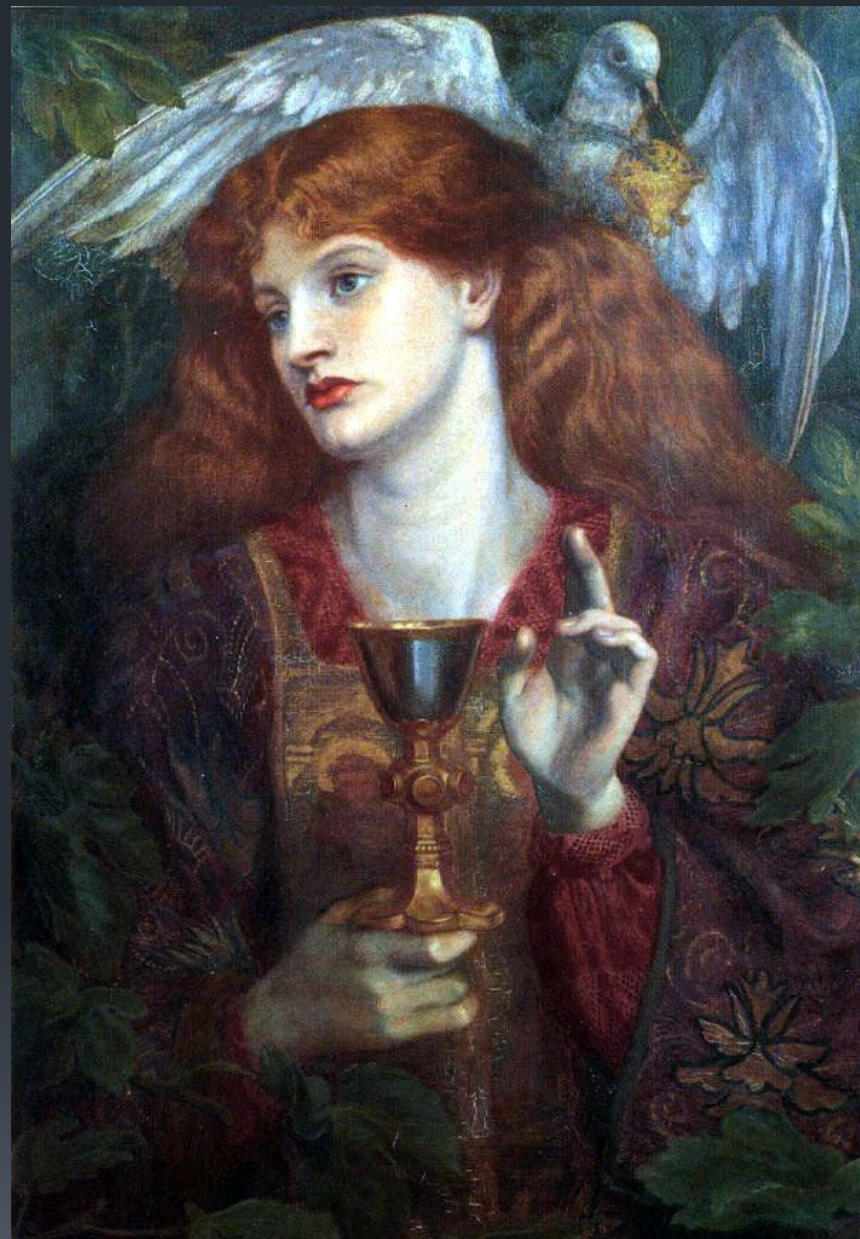
Данте Габриэль Россетти. «Святой Грааль»