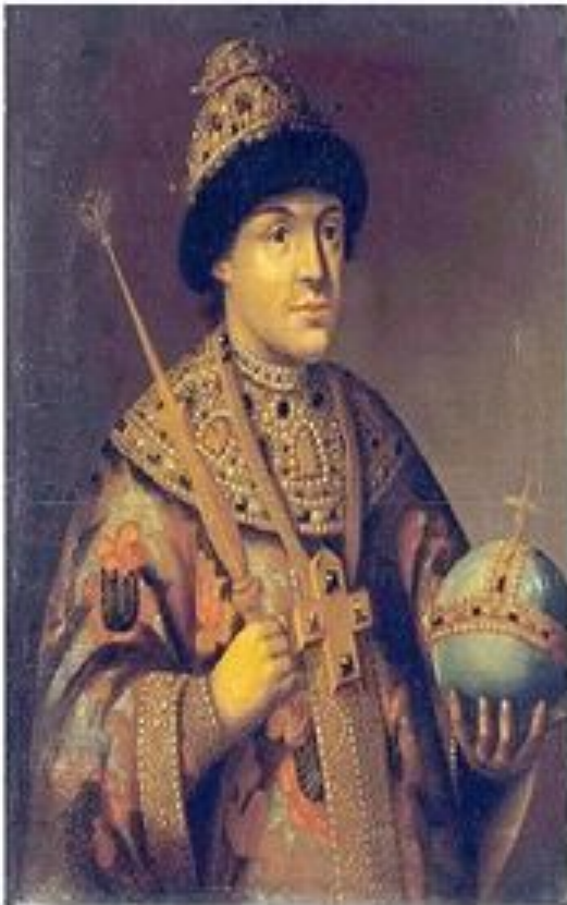
Фёдор Алексеевич (1676-1682)