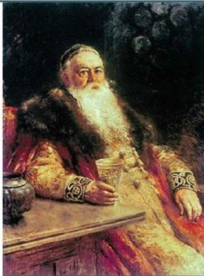
Боярин Борис Иванович Морозов (1590—1661)