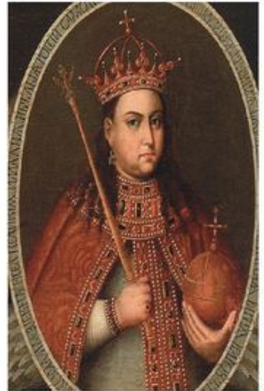
Софья Алексеевна (1682-1689)

Симеон Полоцкий. Фигурное стихотворение в форме сердца «От избытка сердца уста глаголят» из цикла «Благоприветствования» «на случай» — в честь рождения царевича Фёдора (1661)