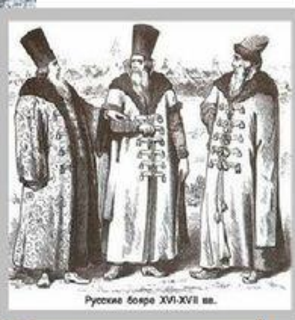
Русские бояре XVI-XVII вв.