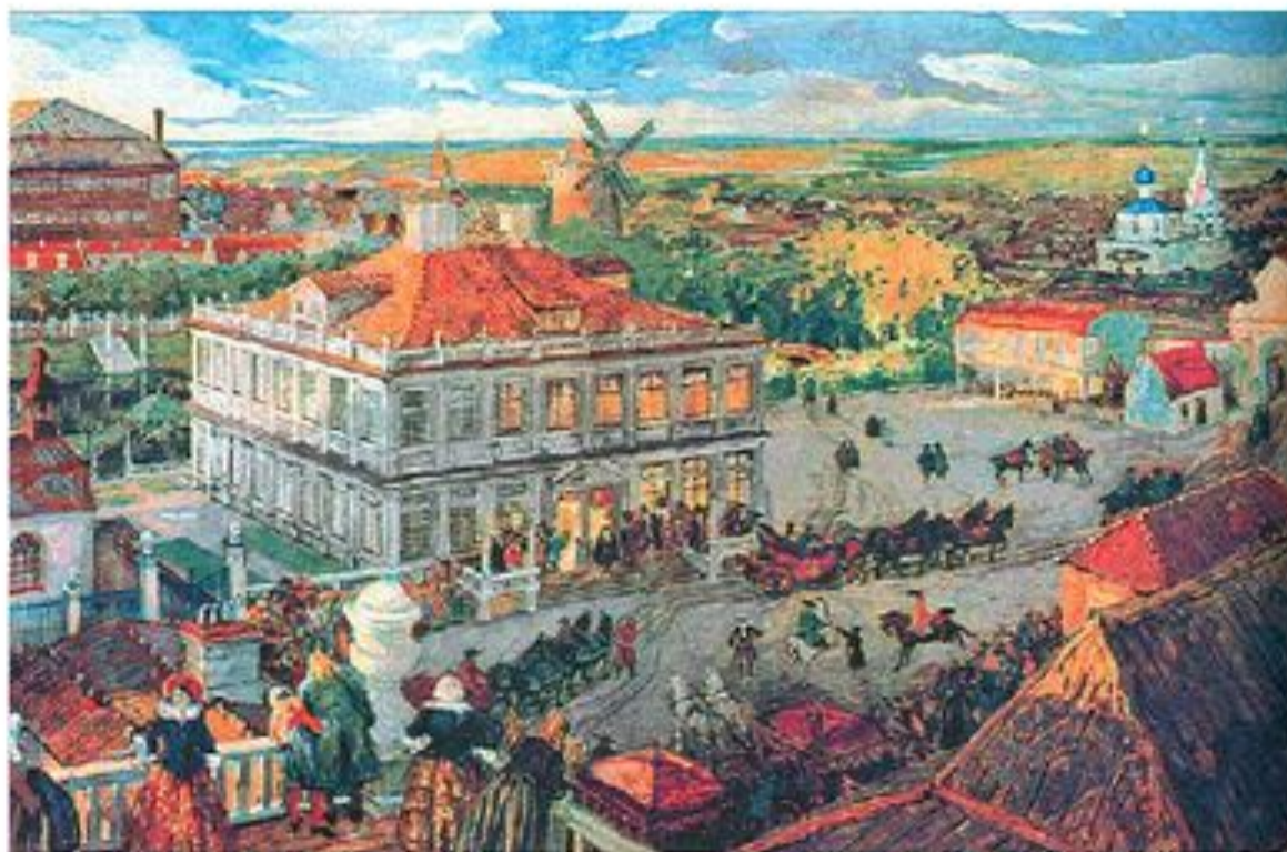
Немецкая слобода в Москве. Бенуа А.Н.