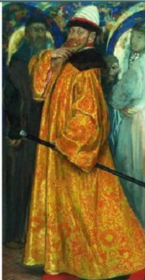
Стольник Илья Данилович Милославский (1595—1668).