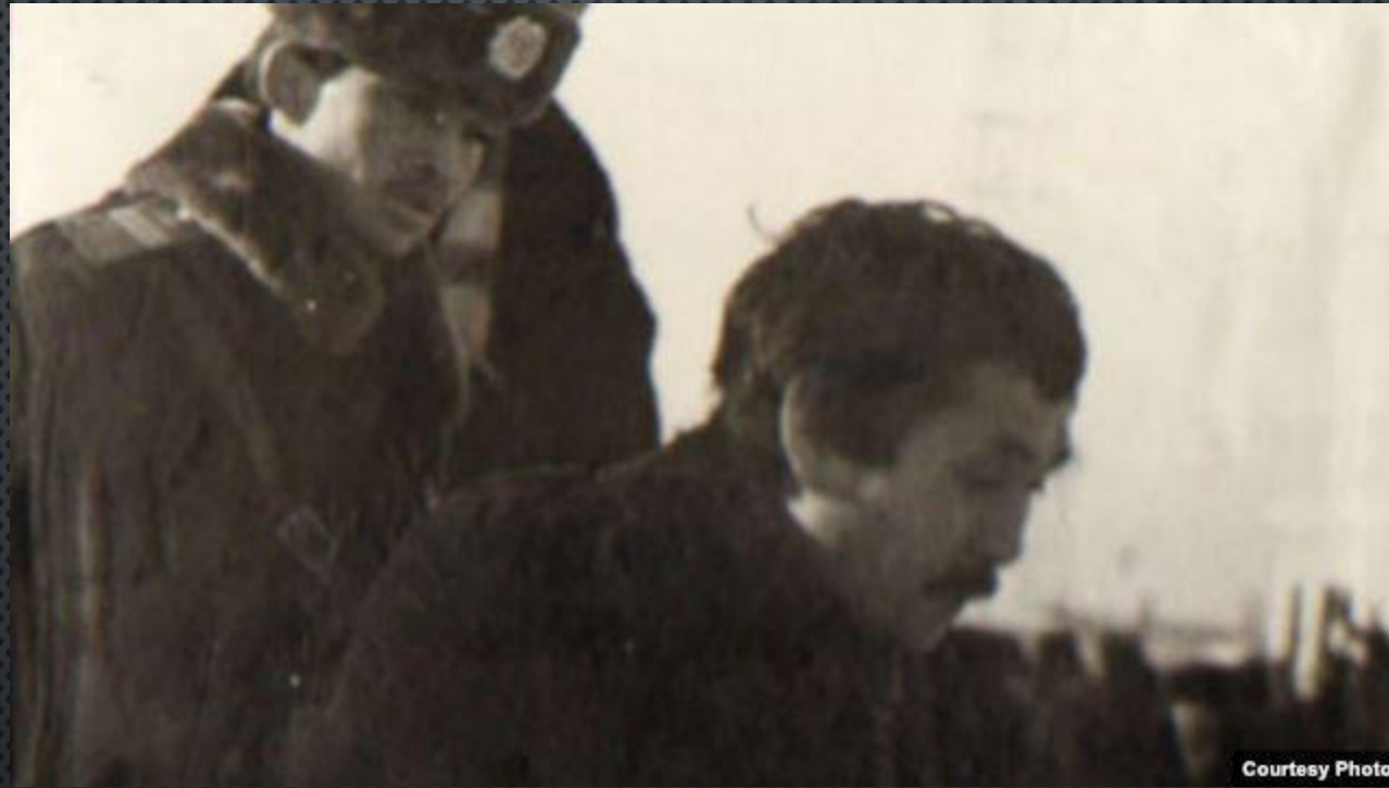
Милиционер Желтоқсан оқиғасына қатысқан жігітті әкетіп барады. Алматы, желтоқсан, 1986 жыл