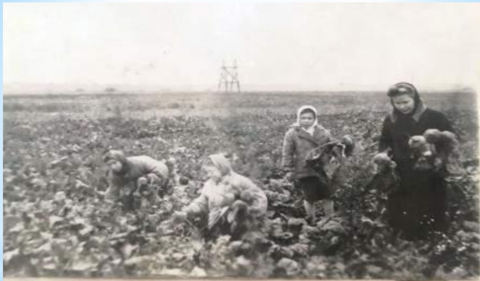
Уборка свеклы в уч хозе.