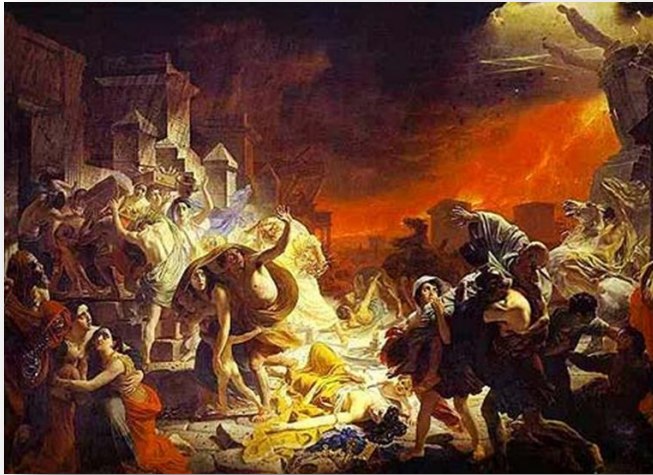
К.П. Брюллов «Последний день Помпеи»