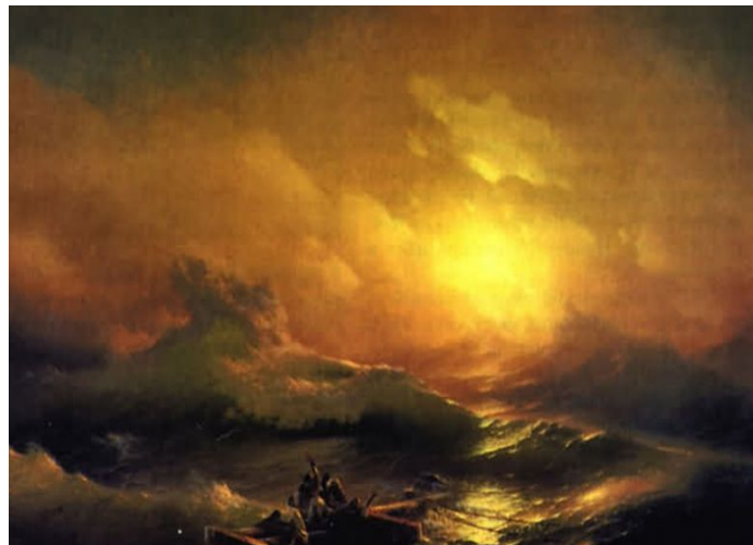
И.К. Айвазовский «Девятый вал»