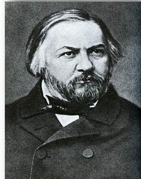
Михаил Иванович Глинка