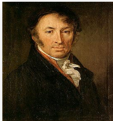
Н. М. Карамзин