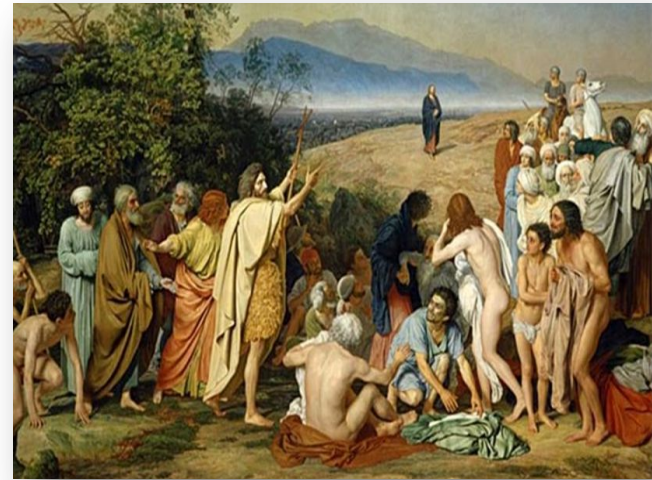
А.А. Иванов «Явление Христа народу»