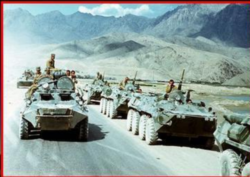
Вывод советских войск из Афганистана (февраль 1989 года).