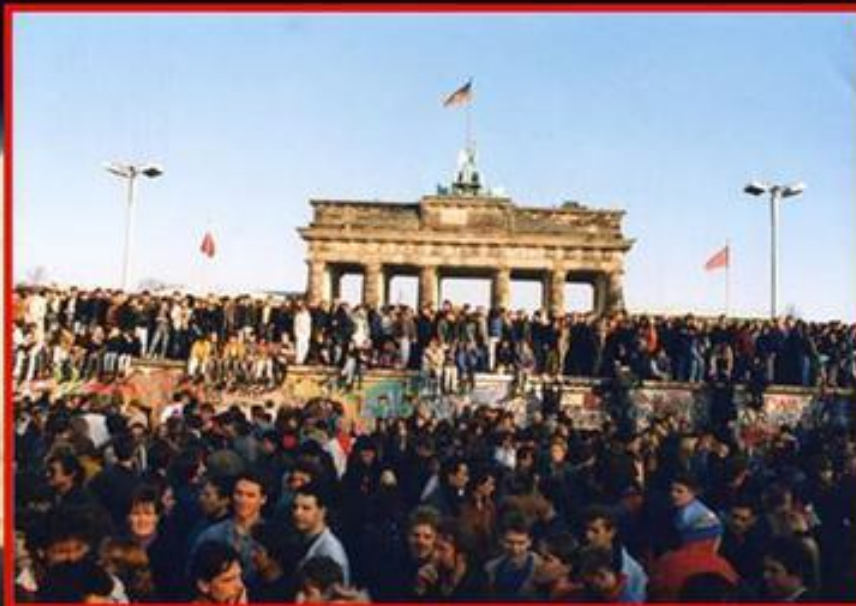
Объединение Германии (октябрь 1990 года).

В конце 1980-х годов СССР вывел войска из Афганистана и дал согласие на объединение Германии. Отношения с Западом стали улучшаться.