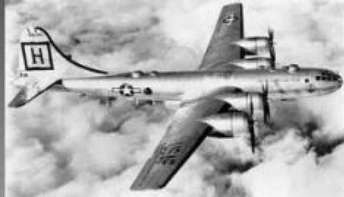
бомбардировщик В-29, США