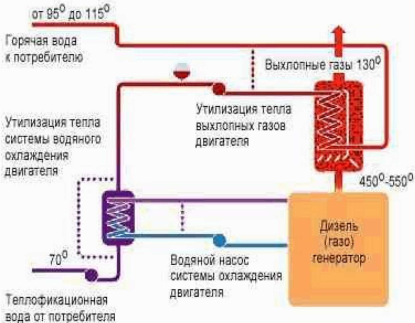
Схема комплексной утилизации тепла