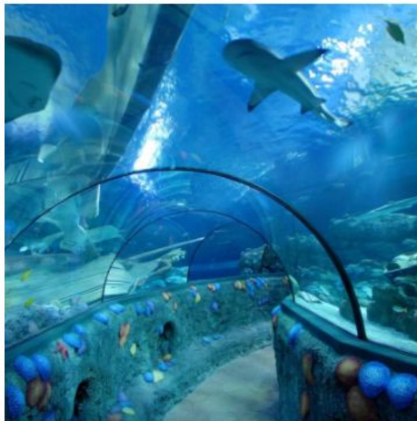
Центр Морской Жизни в Брайтоне