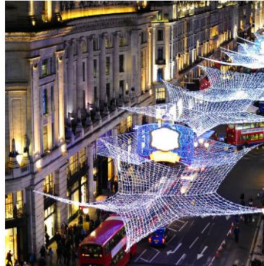
Шоппинг по Oxford Street