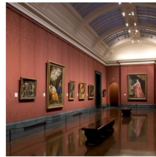
Национальная галерея Лондона