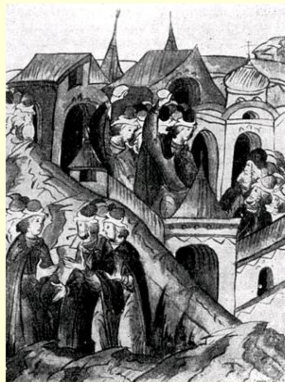
Восстание в Москве в 1547 г.

Последствие: убедило царя о необходимости проведения реформ.