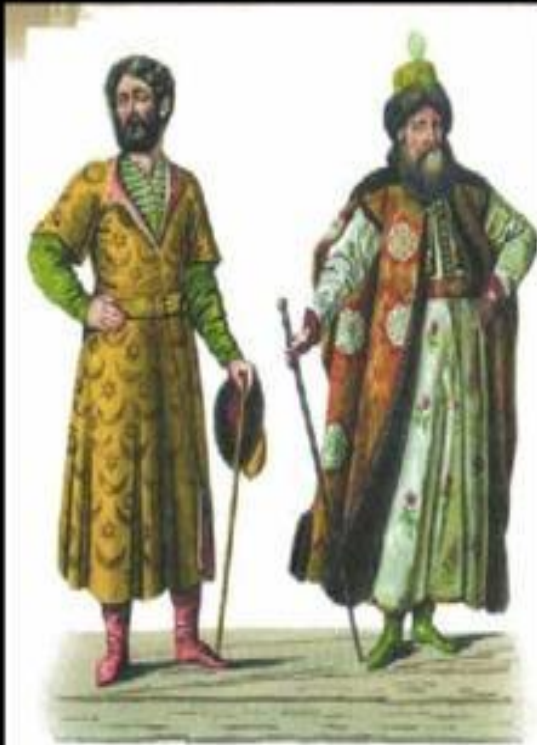
Бояре в XVI—XVII вв.

Итоги боярского правления были печальны. Бояре стремились к личному обогащению, каждый мечтал получить в управление богатые города и земли. Наместники бесчинствовали и грабили местных жителей.росло число разбоев, проявлялось недовольство «низов» своим положением.