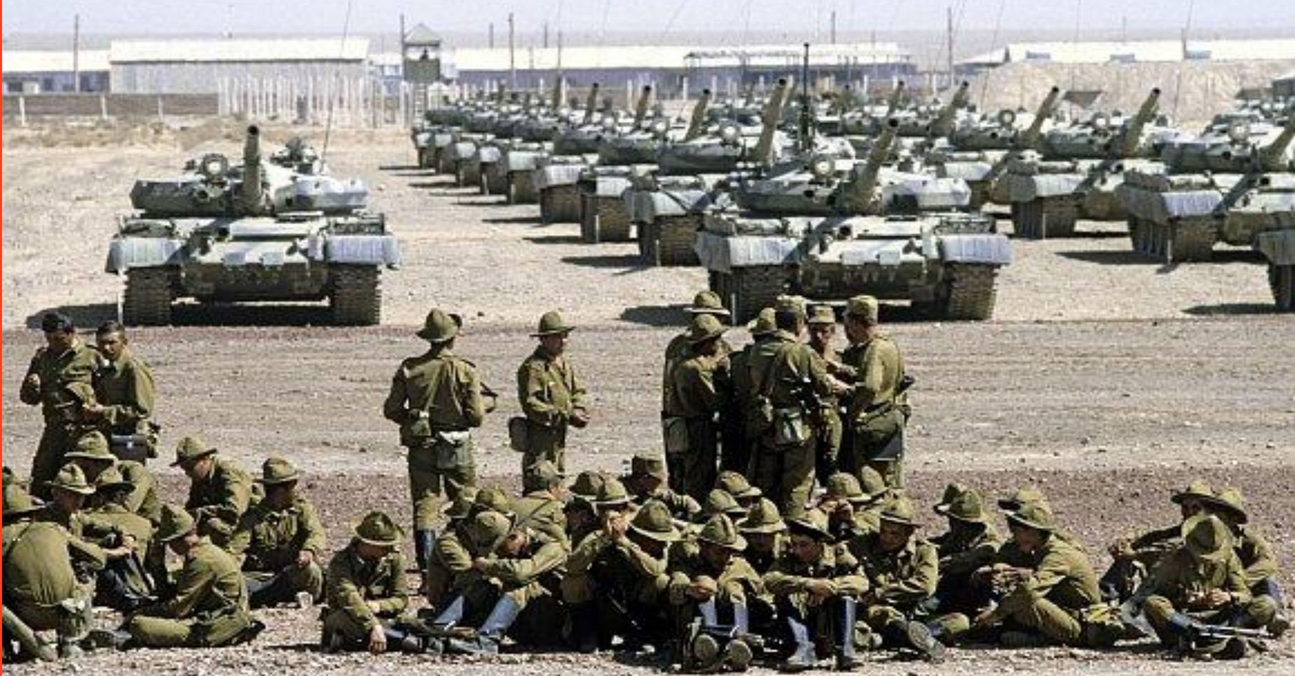
Ввод войск в Афганистан 1979-1989