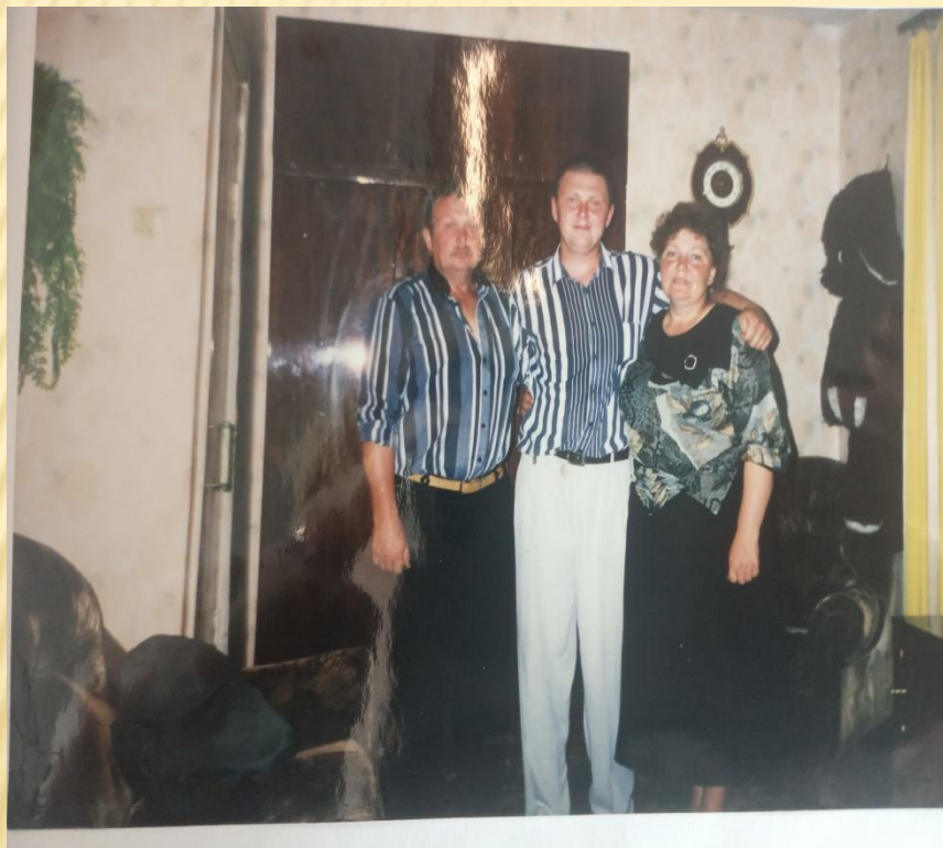
15 ИЮНЯ 1998 Г. ПРОВОДЫ В РА КОСОЛАПОВО