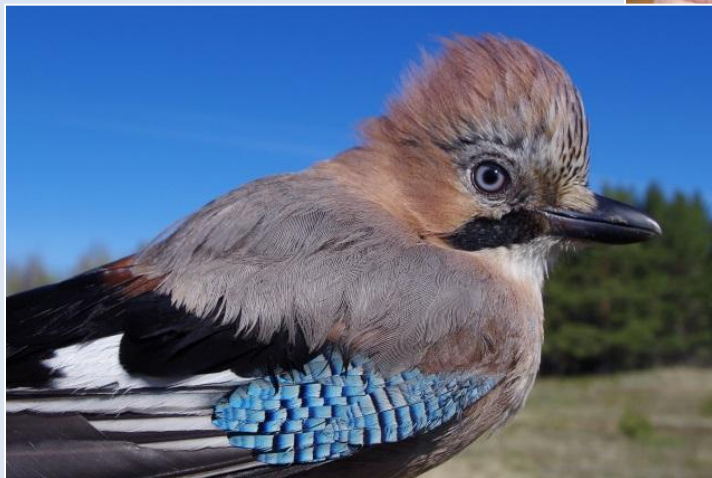
Сойка Garrulus glandarius

За сезон отлавливаем и кольцуем около 8-10 тыс. особей 100 видов. Преимущественно это певчие воробьиные птицы