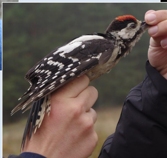
Белоспинный дятел Dendrocopos leucotos