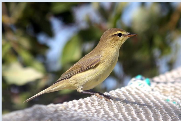
Пеночка-теньковка Phylloscopus collybita