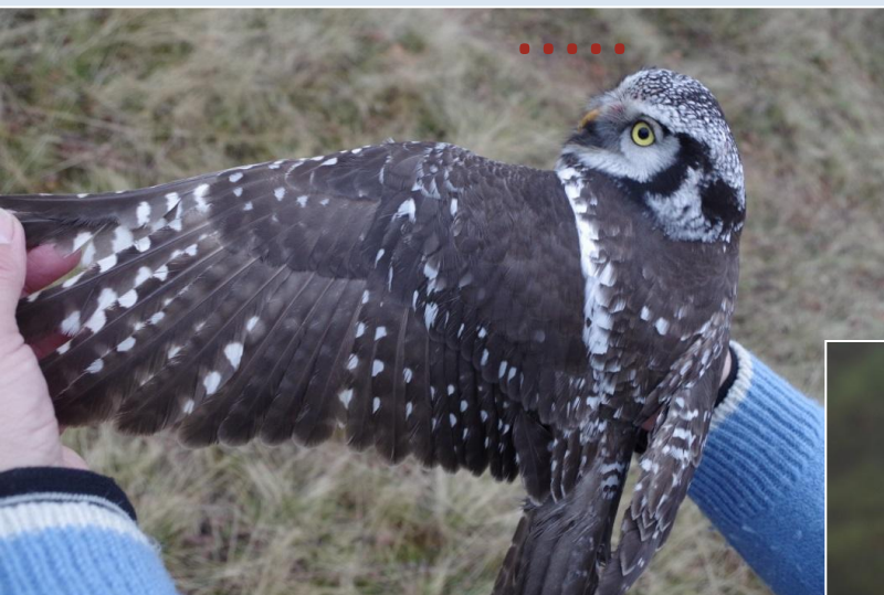
Ястребиная сова Surnia ulula