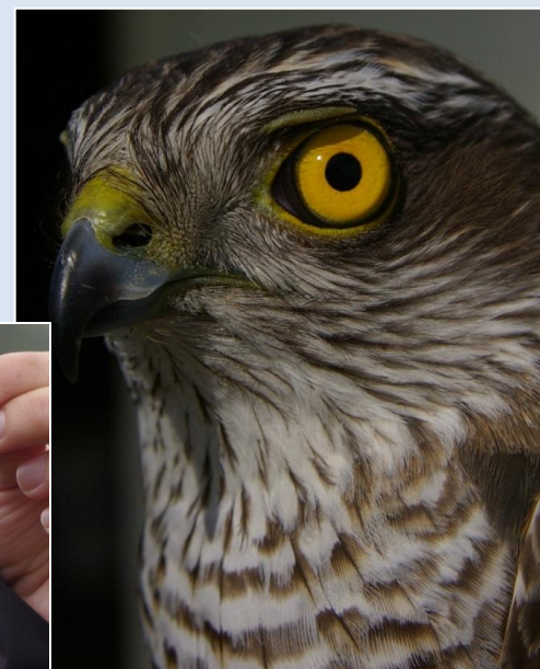
Перепелятник Accipiter nisus