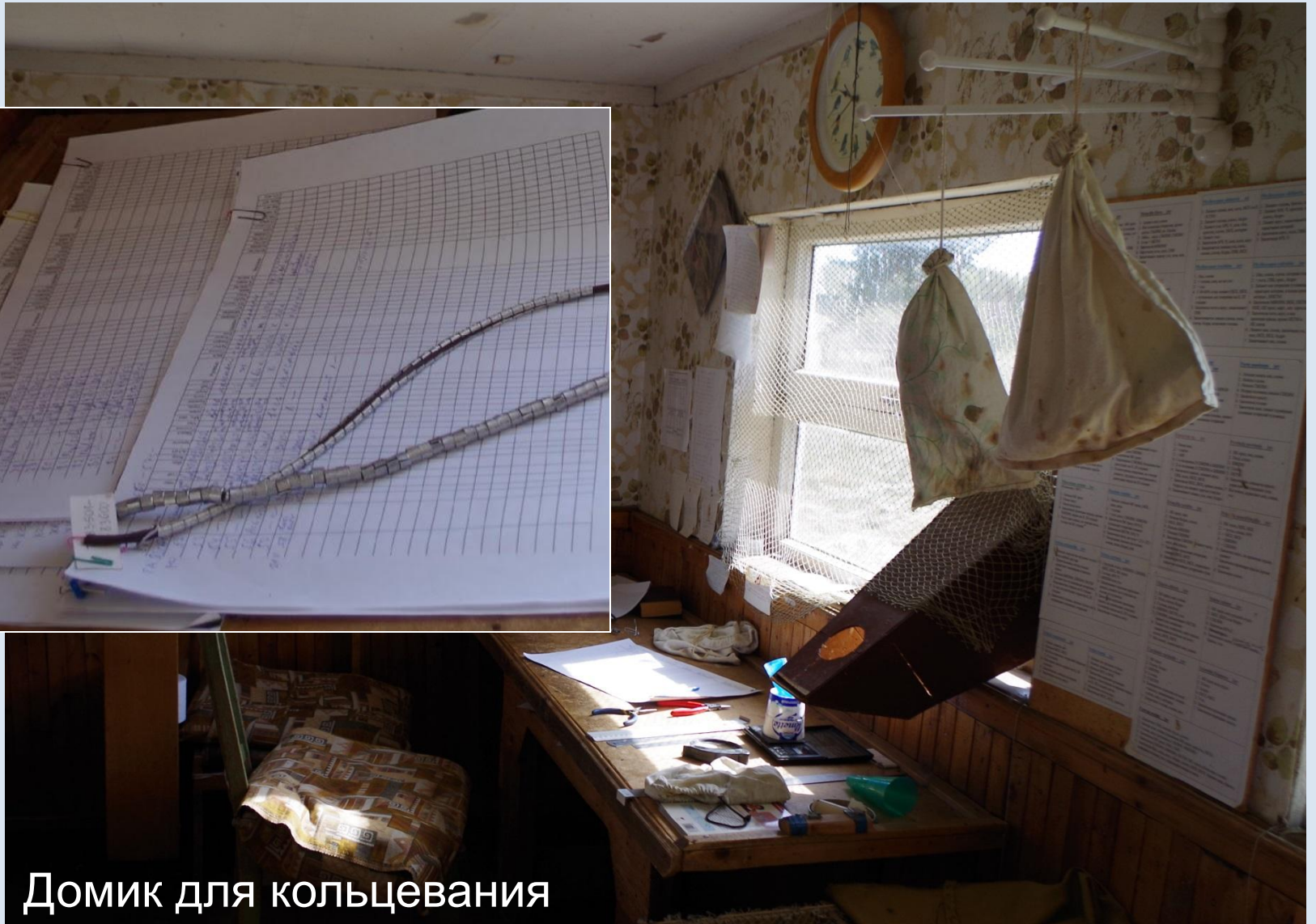
Домик для кольцевания