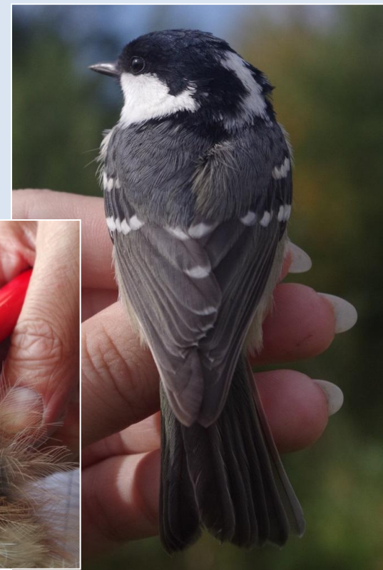
Московка Parus ater