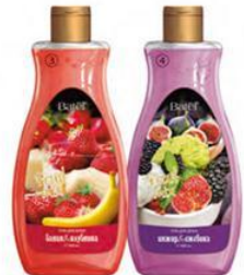
3. Гель для душа «Банан-клубника», 460 мл 4. Гель для душа «Инжир-ежевика», 460 мл