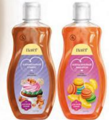
1. Гель для душа «Манго-маракуйя», 460 мл 75511 2. Гель для душа «Банановый маффин», 500 мл ** 75508 5. Гель для душа «Карамельный пудинг», 500 мл ** 75509 6. Гель для душа «Апельсиновый макарон», 500 мл ** 75510

Batēl | КАЧЕСТВО ГАРАНТИРОВАНО ISO 9001:2008 | ГЕЛИ ДЛЯ ДУША