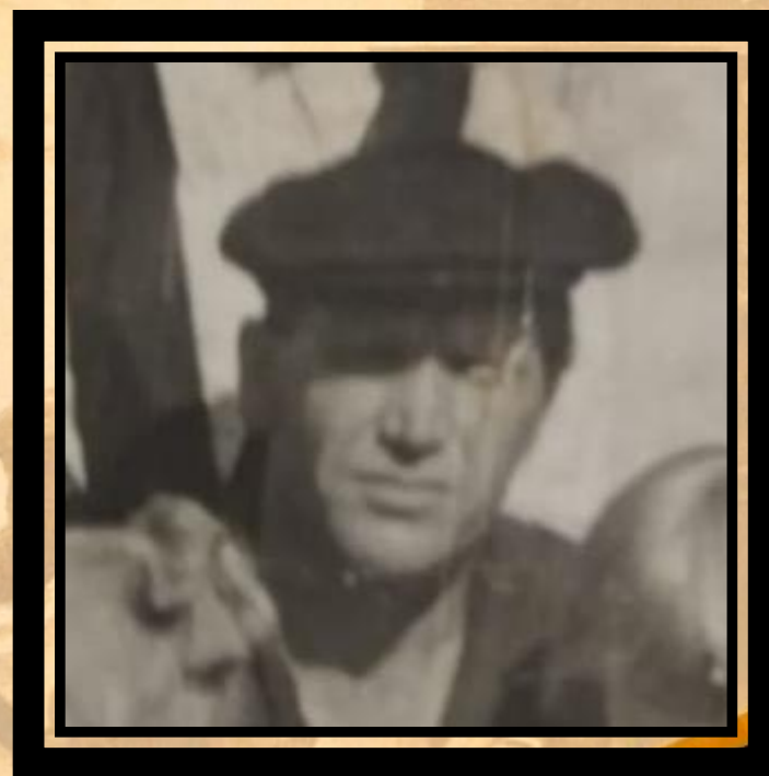
Епишев Григорий Иванович