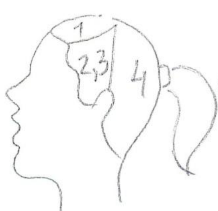
Деление на зоны Хвост вид