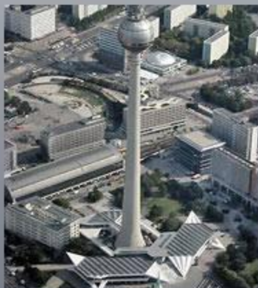
Телебашня в Берлине