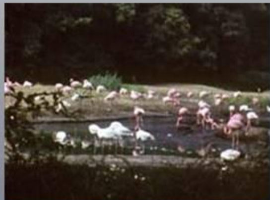
Берлинский зоопарк крупнейший в мире