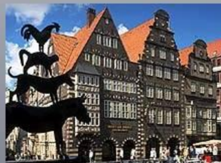
Город Бремен. Памятник бременским музыкантам