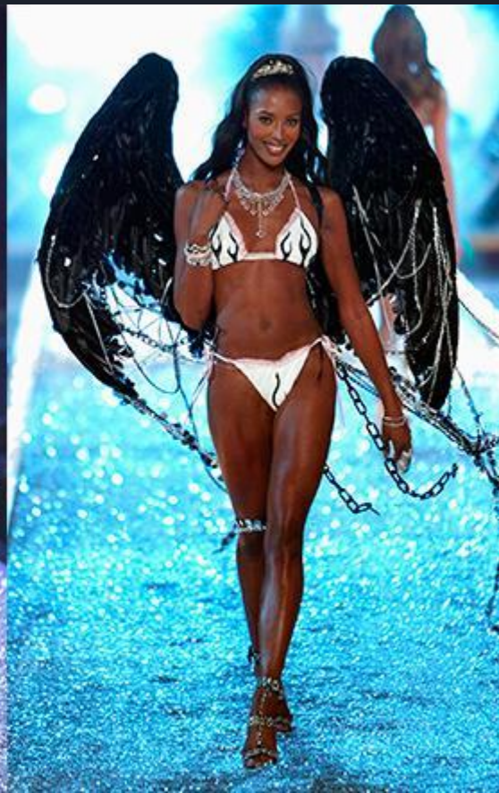
Naomi Campbell war einer der "Engel" von VICTORIA 's SECRET.