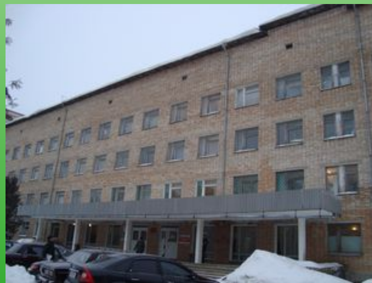
Поликлиника №1 и № 4