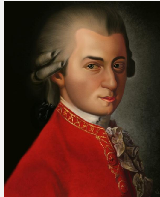
Вольфганг Амадей Моцарт