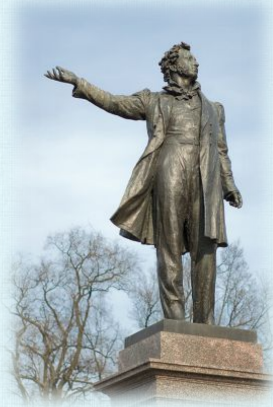
Памятник А.С. Пушкину в Санкт-Петербурге.