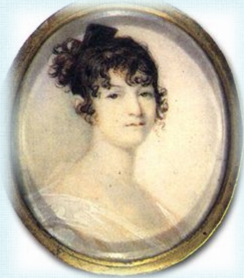
Мать : Надежда Осиповна Пушкина.

А.С. Пушкин родился в дворянской семье в Москве 6 июня 1799 года. В семье Пушкиных было 3 детей. Александр был средним. Старшую сестру звали Ольгой, младшего брата— Львом.