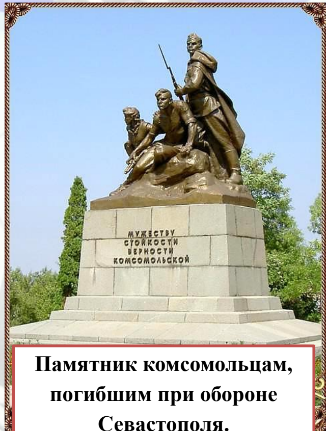
Памятник комсомольцам, погибшим при обороне Севастополя.

В НАСТОЯЩЕЕ ВРЕМЯ СОБЫТИЯ ГЕРОИЧЕСКОГО ПРОШЛОГО ОТОБРАЖАЮТ МНОГИЕ СЕВАСТОПОЛЬСКИЕ ПАМЯТНИКИ И МУЗЕИ.